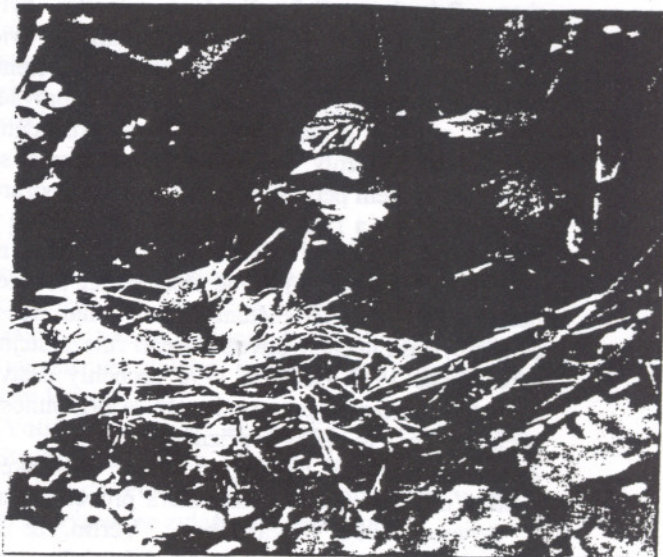
Sameček tuhyka obecného krmí mláďata na hnízdě.