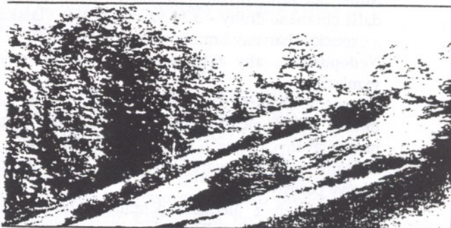
Kácením křovin se zničí hodně hnízdišť zejména u tuhyků.