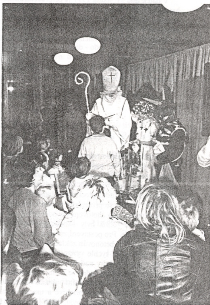
Ohlédnutí za činností ZUŠ Karolinka.