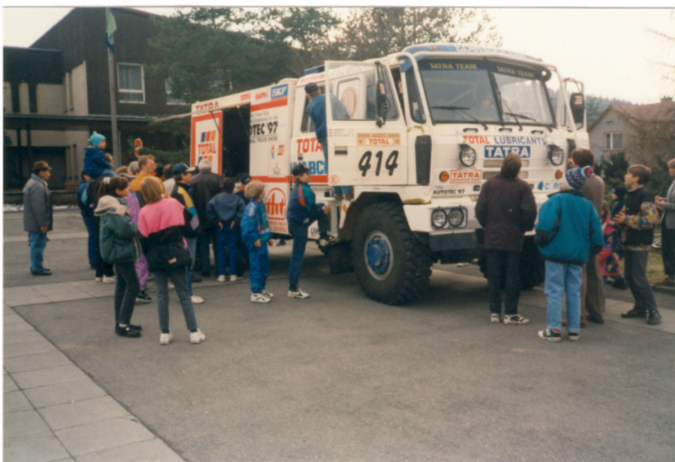
Na prohlídce vozu TATRA.