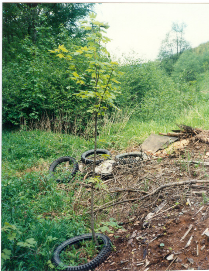
"K R Á S Y" údolí Kobylská