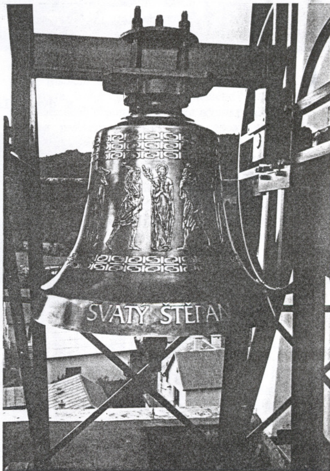
Největší zvon na věži našeho kostela (váha 350 kg)