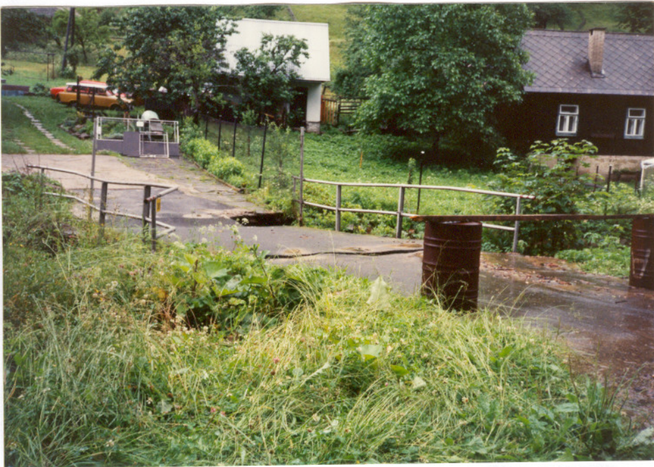
Podemletý mostek v Ratkově dne 9.7.1997