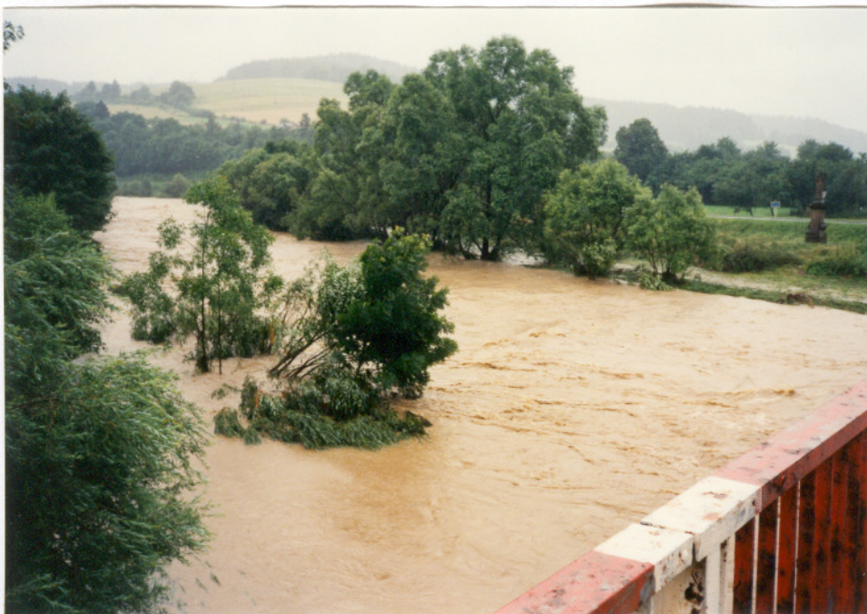
Rozvodněná Bečva v Ústí dne 9.7.1997