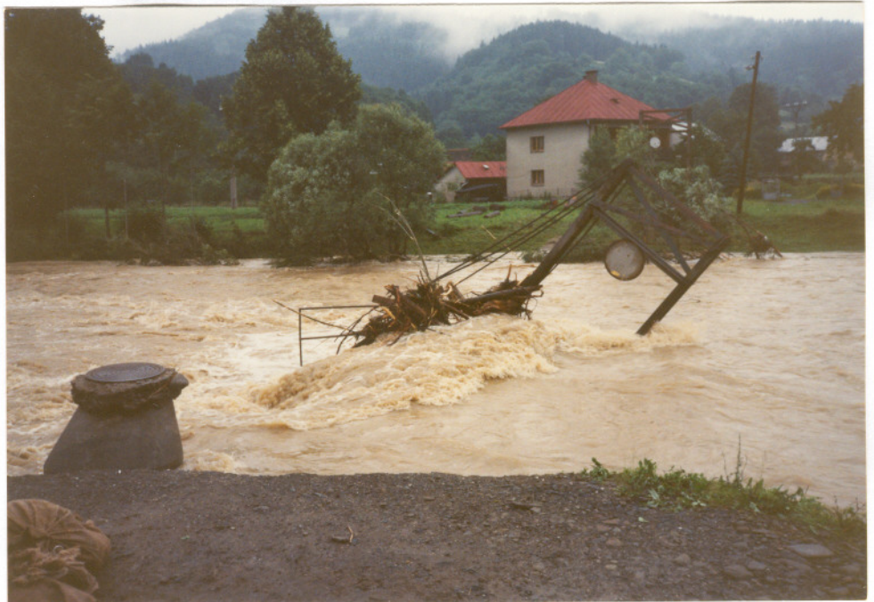
Stržená lávka v Novém Hrozenkově dne 9.7.1997