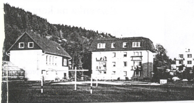
Zastřešení biologické učebny v r. 1995 a nastavba 2 bytových jednotek v roce 1996 na domu č. 248