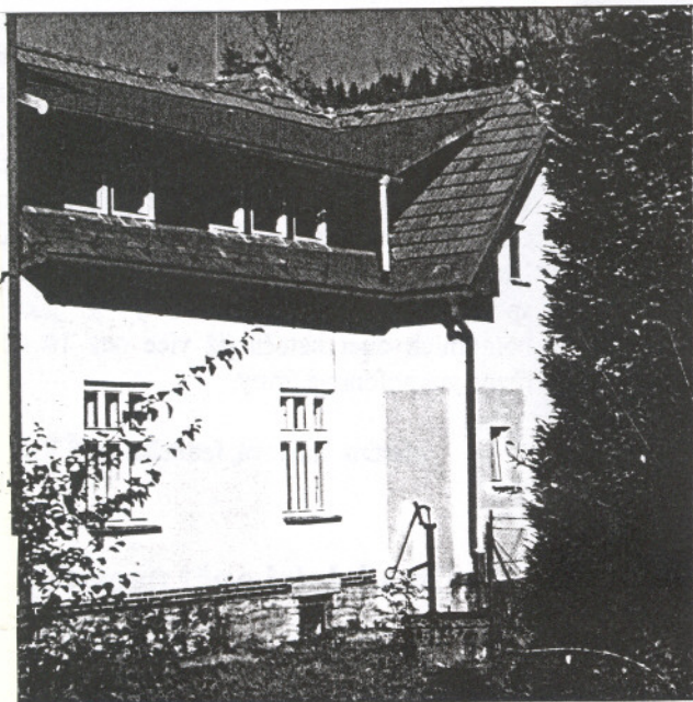
Dvě nové bytové jednotky za zdravotním střediskem