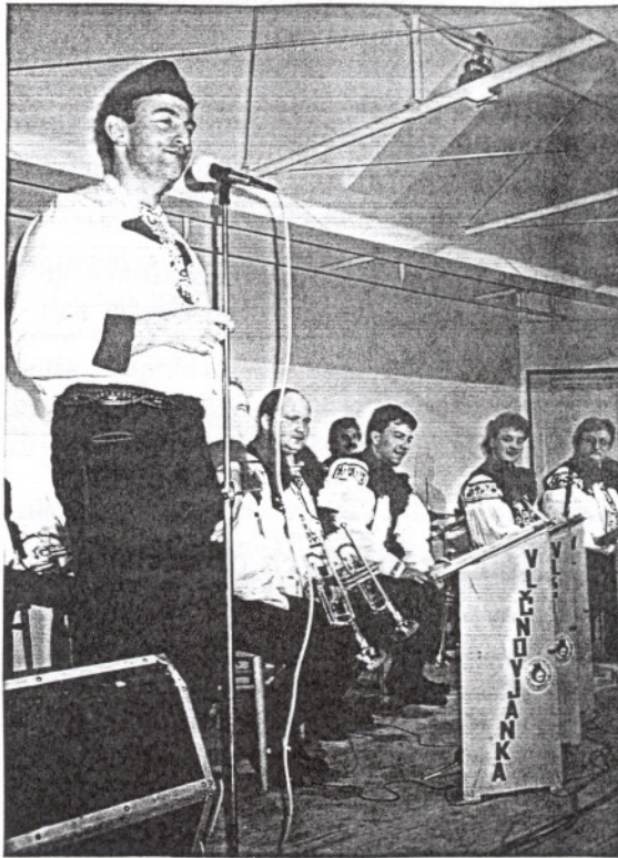
Vlčnovjanka v akci