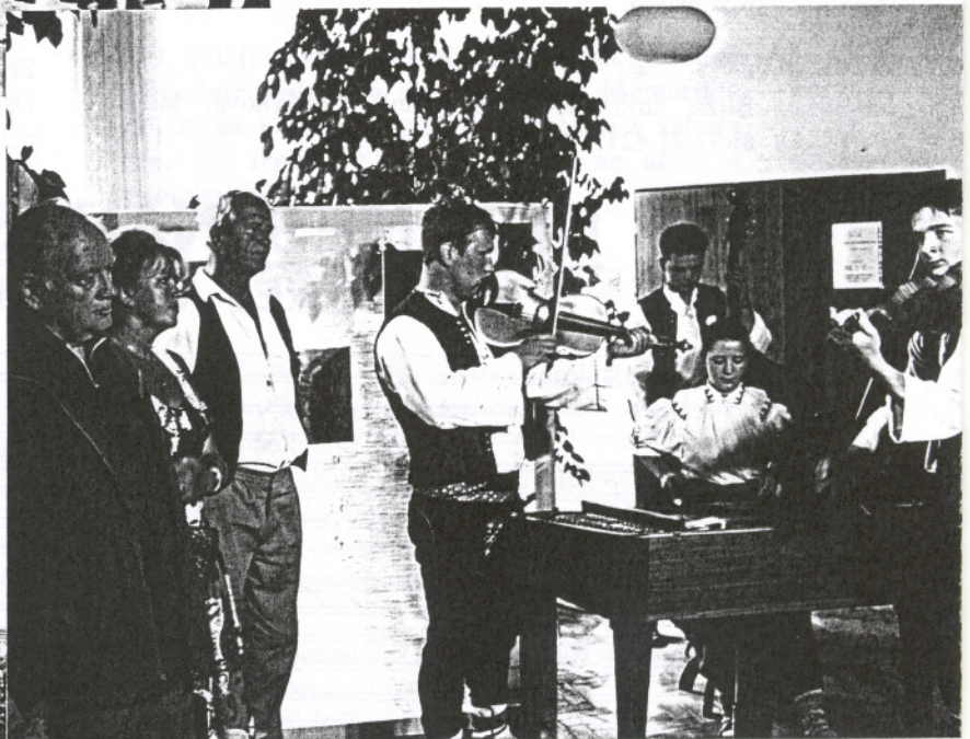
Vernisáž výstavy URGATINA