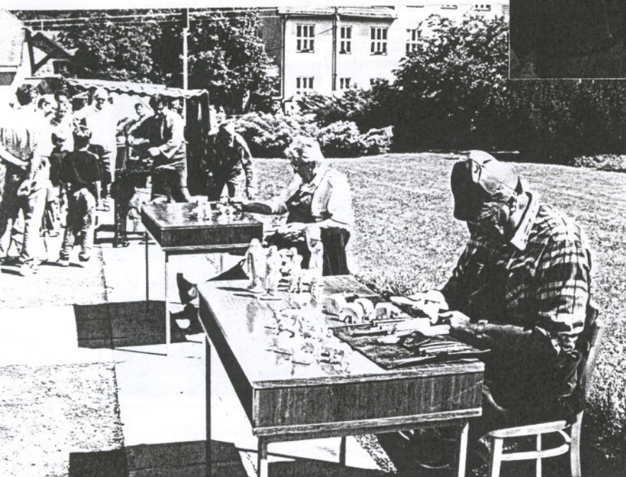
Ukázka řezbářského umění