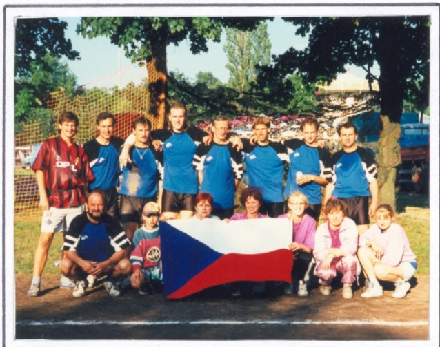
Volejbalový oddíl TJ Karolinka po loňském triumfu v německém Welzowě

Mimoto se zúčastňují různých turnajů (např. v Hodoníně - 7. místo), jednoho z největších turnajů v Evropě - Dřevěnice v Čechách, turnaje v okrese (Valašské Meziříčí - 4. místo).