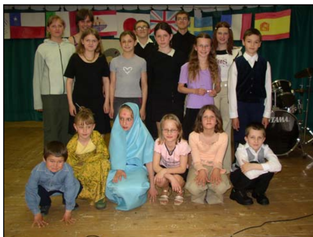
Mnohé z účinkujících byly oblečeny ve stylovém oblečení a na závěr koncertu bylo pořízeno společné foto všech.