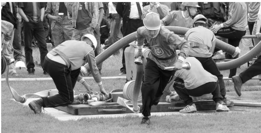
Mladí karolinští hasiči vyrážejí do požárního útoku při okresní soutěži ve Zlíně