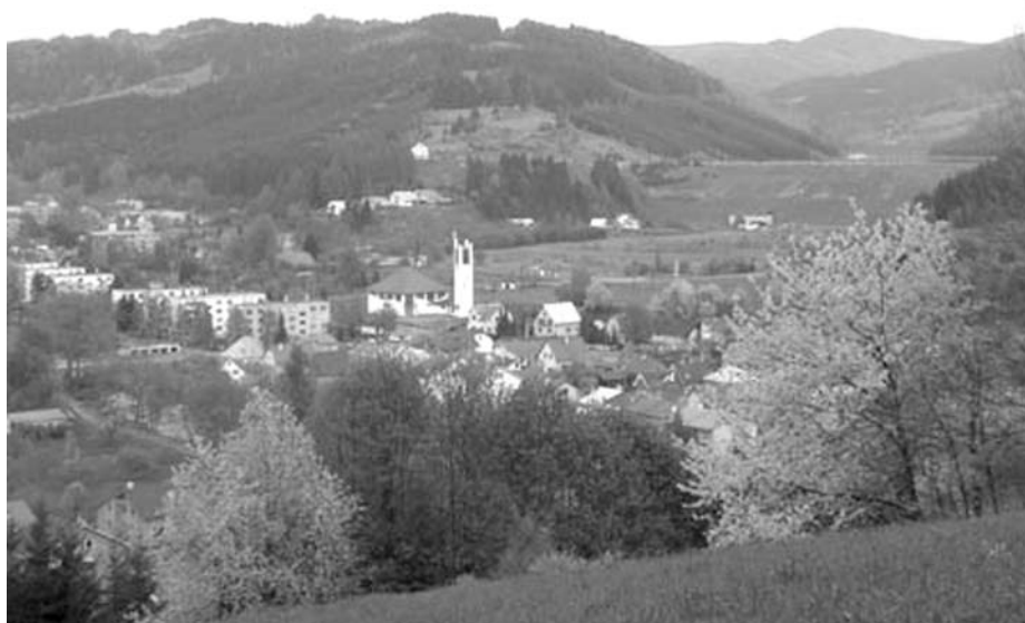
Pohled na Karolinku

V oblasti infrastruktury byla prodloužena větev dešťové kanalizace před kostelem v částce 435 tisíc korun a co se týká oprav