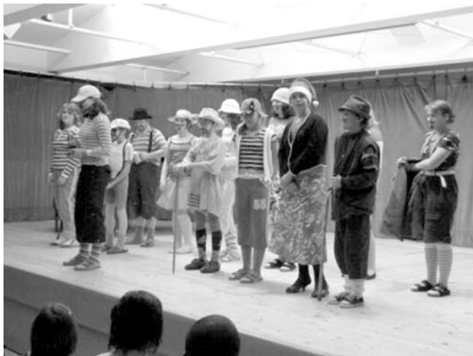
Momentka ze školní akademie konané letos v lednu

V březnu naše škola pořádala krajskou soutěž v sólovém a komorním zpěvu, kde se umístily na pěkných místech i žákyně naší školy. Uspořádali jsme i II. ročník pěvecké soutěže Karolinka hledá Supers-tar. Pěvecké oddělení připravilo na konec května ještě muzikál pro