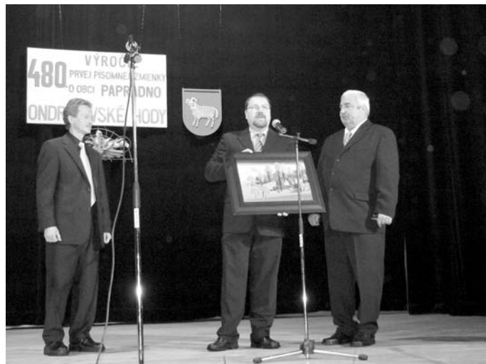
Zástupci města předávají pamětní dar starostovi družební obce Papradno