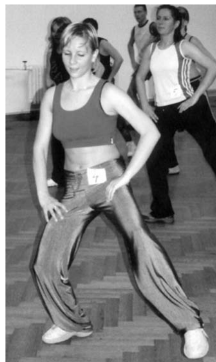
Oku lahodící pohled na jednu z účastnic Aerobik maratonu

Dalším velmi aktivním oddílem TJ sokol je vzpírání: Tady si především velmi dobře vede Jiří Orság, který opět vyhrál mistra České republiky juniorů v nadhozu a trhu. Celé družstvo má 2 členy a pravidelně se účastní vzpěračských soutěží. Oddíl se zúčastnil také mistrovství Evropy v Itálii, největšího úspěchu pak dosáhl na mistrovství Čes-