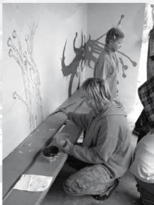
Mobility artistry Karolinka: S pomocí prázdných