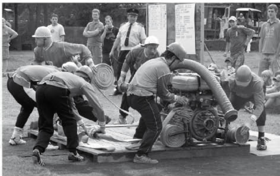
Dokonalá sekvence při požárním útoku mužů

kde řidič havaroval do potoka a ve Velkých Karlovicích Jezerném, kde osobní vozidlo vyjelo mimo vozovku a došlo tak k poškození svodidel i vozidla. Poté jsme v rámci technické pomoci asistovali záchranné službě Vsetín ve Velkých Karlovicích Pluskovci s transportem zraněného ze špatně přístupného místa.