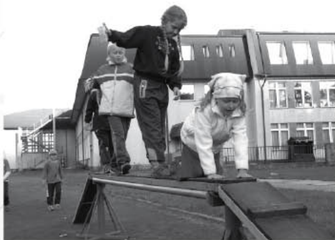
Co kolky, po čem se dá přelezt, stojí za vyzkoušení