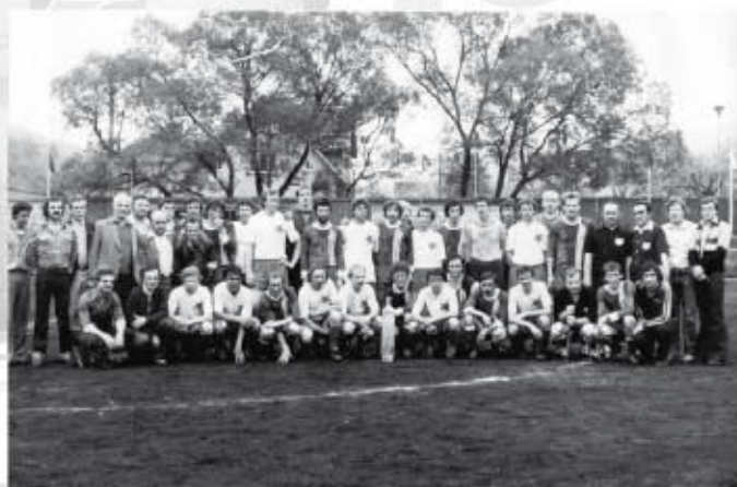
Společné foto fotbalistů TJ Karolinka a Slávie Praha při přátelském utkání v roce 1980 na starém škvárovém hřišti