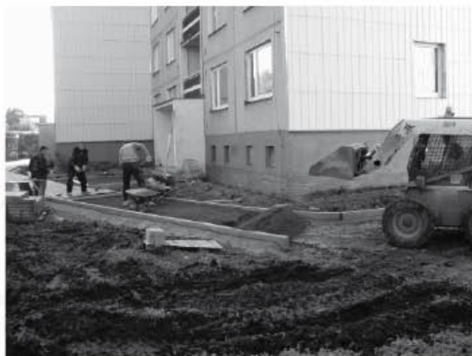
První metry nových chodníků se objevily v minulých dnech na sídlišti Pod Paluchem v rámci jeho regenerace

Mnozí občané Karolinky včetně přespolních sledují, jak postupují stavební práce na rekonstrukci náměstí. Pro všechny je nepříjemné omezení v přístupu na radnici, poštu, policii a k bankomatu, včetně možného zaparkování vozidel. Řidiči by měli více využívat prostory pro parkování za budovou městského úřadu, odkud je i lepší a bezpečnější přístup.