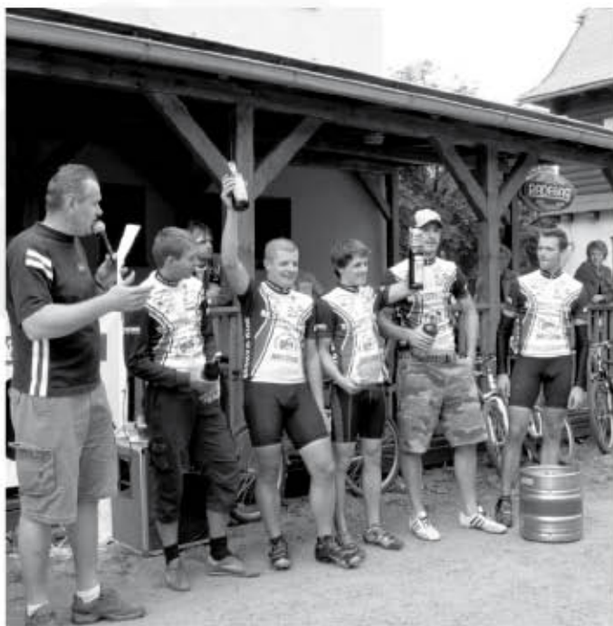
Vítězný tým závodu Zavolej mi do klubu s hlavní cenou

Letošního již devátého ročníku tohoto recesního závodu na horských kolech se zúčastnilo rekordních sedmdesát osm účastníků. Pořadatelům i závodníkům přalo počasí, proto se jel závod i přes tradiční brod řeky.