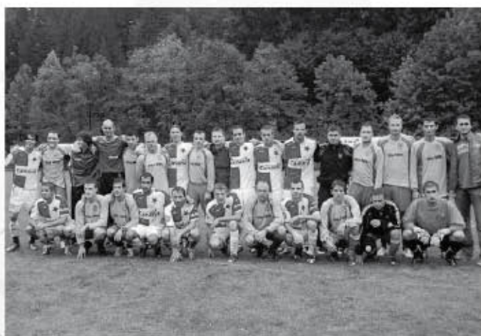
Společné foto fotbalistů FC VK+K a Slávie Praha při utkání druhého kola letošního ročníku Poháru ČMFS