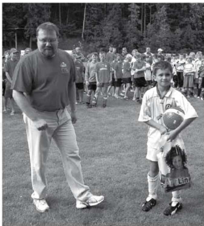
Na snímku ze zdvřechého ceremoniálu Baumit junior soccer cupu vítíme v popředí nejlepšího střelce turnaje společně se starostou města