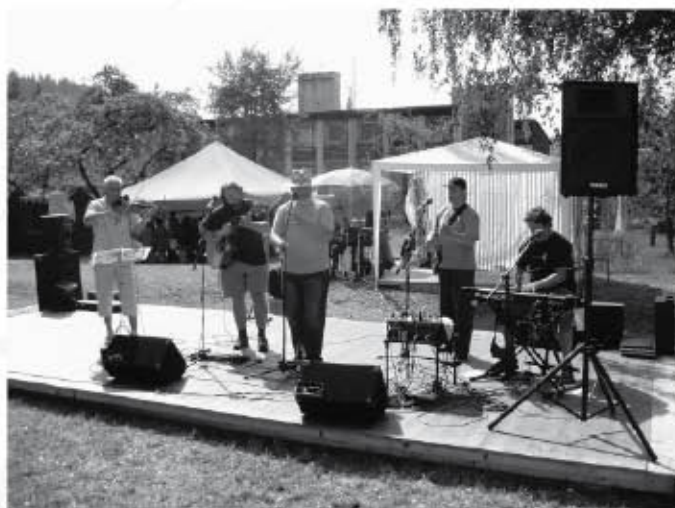
Velký aplaus u diváků sklidil koncert skupiny Veselá bída

Sběratel koupí kvalitní díla malíře Františka Strážnického Prosím, nabídněte.