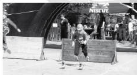
Momentka z plekádňového běhu na šedesát metrů