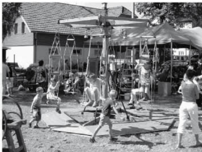
Kolotoč, který byl součástí kulturního vystoupení Bílého divadla, po představení obsadily děti