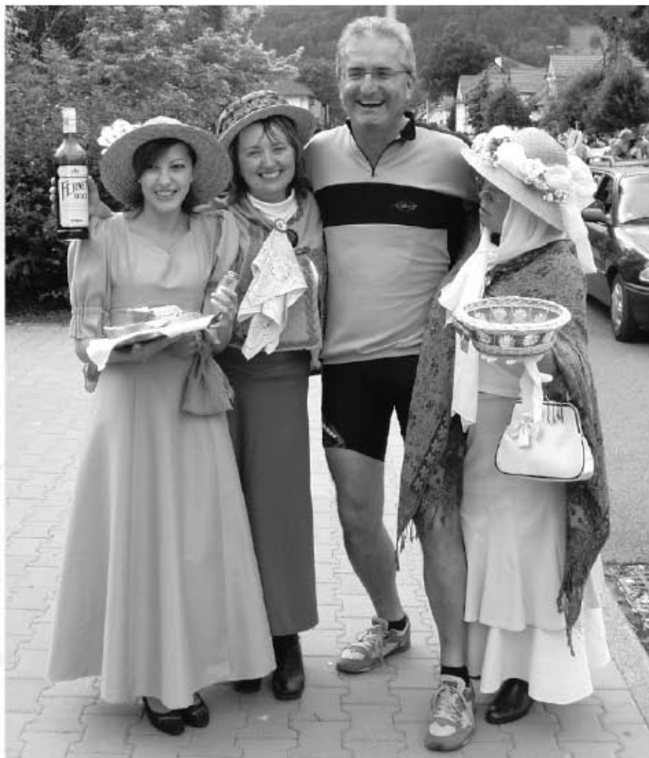
Chlebem, solí a fernetem vítaly účastníky rallye pracovníce infocentra s paní místostarostou. Neudal jim ani šéfredaktor našeho Zpravodaje