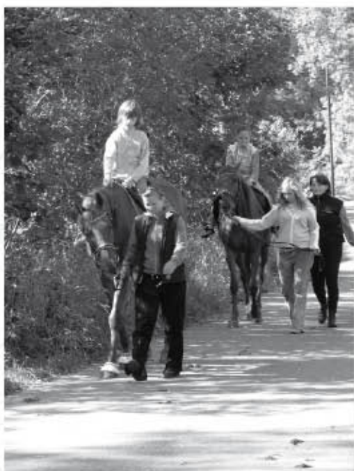
Rodač ústředního dětského dne si s chutí vyzkoušeli to, že ku ma domy