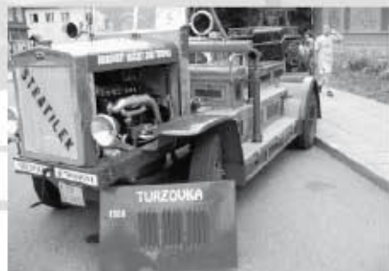
Hasičská stříkačka ze slovenské Turzovky