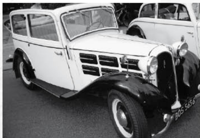
Jako každý automobil značky BMW, ani tento veterán nezpřel svoji noblesu