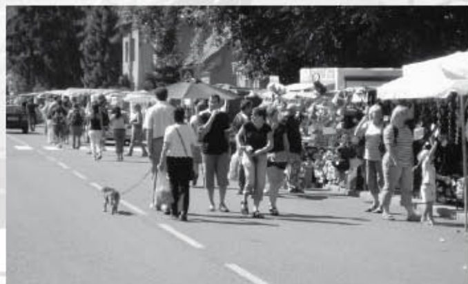
Stánky prodávající a zástupy návštěvníků zaplnily v den jarmarku Vsetínskou ulici