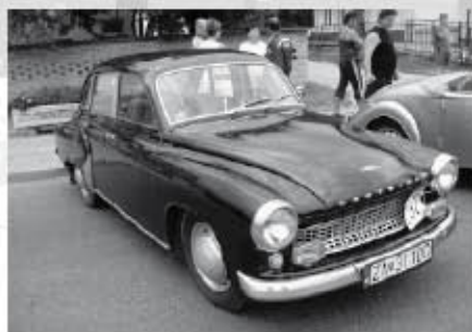
Při pohledu na tohoto veterána značky Wartburg můžeme směle konstatovat, že tady soudruzi z NDR chybu neudělali