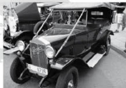
Pragovka - veterán se všim v Sudy