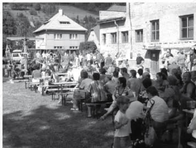
Návštěvníci jarmarku měli na Dřevnické louce postaveno o zábovu v podstatě po celý den