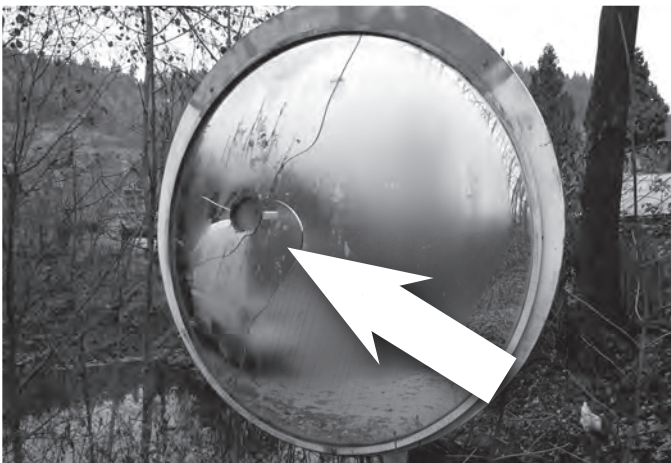
Ani toto zrcadlo u místní komunikace Pod Hrází neodolalo vandalům