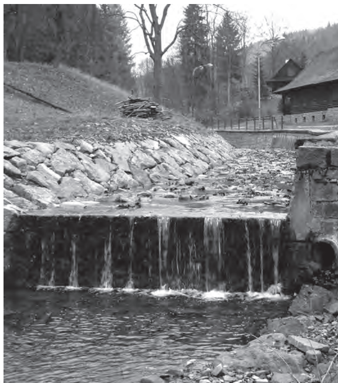
Pohled na část opraveného koryta Radkovského potoka