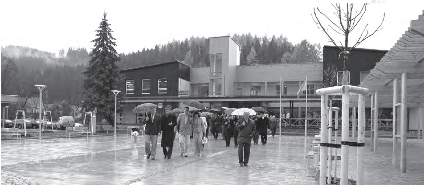
Skupina hostů přichází po novém náměstí k místu slavnostního přestřižení stuhy

Vážení spoluobčané, je tu opět předvánoční čas. Rok s rokem se se- šel a my bychom měli bilancovat, co se v le- tošním roce povedlo a co ne.