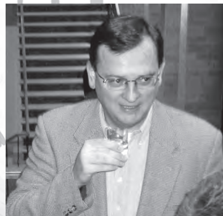
Po uvítání na městském úřadě neodolal právě valašské slivovici ani ministr Petr Nečas

Rád bych podotkl, že co do rozsahu se jednalo o největší investiční akci za posledních deset let. Říká se, že náměstí dodává městu určitý ráz. Ze zanedbaného parkoviště před městským úřadem se architektům a hlavně všem řemeslníkům a stavařům podařilo vytvořit ucelenou plochu s moderním a nadčasovým řešením. Věřím, že Karolinku posune rekonstruované náměstí blíž k větším a výstavnějším městům. Náměstí je místo, kde se lidé mohou scházet, a tak doufám, že nové náměstí bude dobře sloužit všem