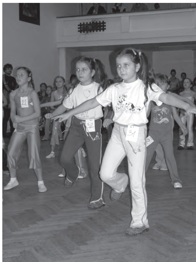
Takto se soustředily na své cvičení účastnice nejmladší kategorie