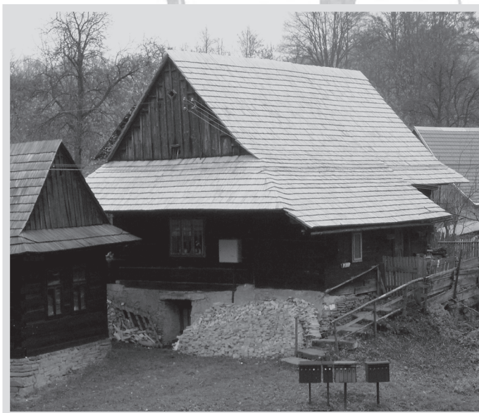
Novotou svítící šindelová střecha usedlosti č. p. 285 v Raťkově