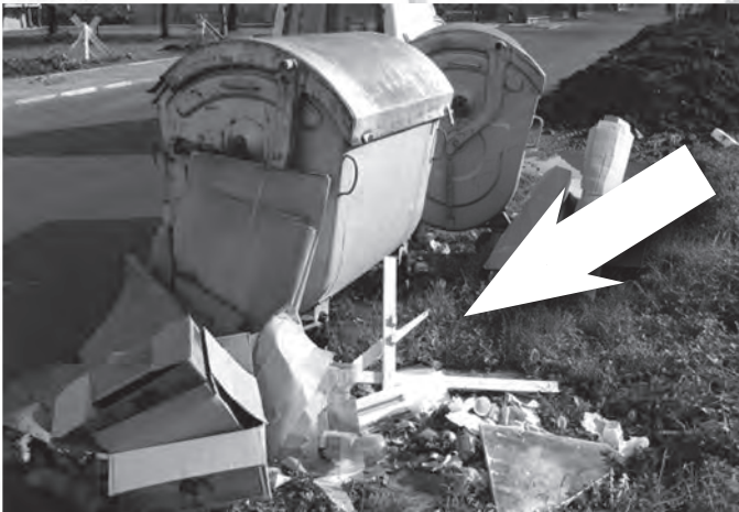
Pouhý den po odvozu je některým obyvatelům zatěžko vyprázdněný kontejner otevřít a klidně odloží odpad vedle něj