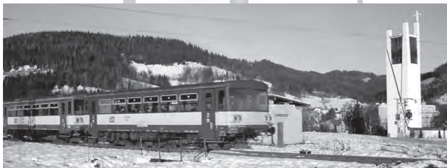
Ilustrační foto - vlak do Vsetína opouští stanovičnou zastávku v Karolince

V opačném směru přijíždí na Vsetín ve zcela nové poloze Ex Fatra a to v 11.08 hodin. Také Košičan pojedou jinak, tentokrát bude na Vsetíně až v 15.08 hod. Místo rychlíku Bečva končí na Vsetíně v 17.08 rychlík Portáš z Prahy, Ex Hradčany přijíždí o hodinu dříve, již v 19.08 hod. a rychlík Bečva se vrací do své tradiční polohy – dojíždí na Vsetín po 21. hodině. Úplně posledním rychlíkem, končícím na Vsetíně, je ve 23.02 Matalík. Záměrně jsem se nezmínil o nočním rychlíku Šírava, který v obou směrech jezdí prakticky beze změn. Jen posilový Vihorlat je zrušen. Souhrnné jízdní řády autobusové dopravy (všechny linek, které přes Karolinku projíždějí) a vlakové dopravy, s návazností spojů na spoje do a z Rožnova pod Radhoštěm na rozcestí Solán a odjezdy vlaků ze železniční stanice Vsetín, jsou přílohou tohoto čísla Karolinského zpravodaje.