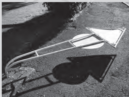
Ohnout dvojitý stojan dopravní značky rovněž vyžaduje poměrně velké úsilí