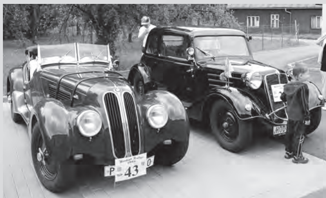
Pýcha každé veterániády - automobily BMW