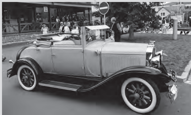
Jeden veterán za druhým defilovaly po karolinském náměstí