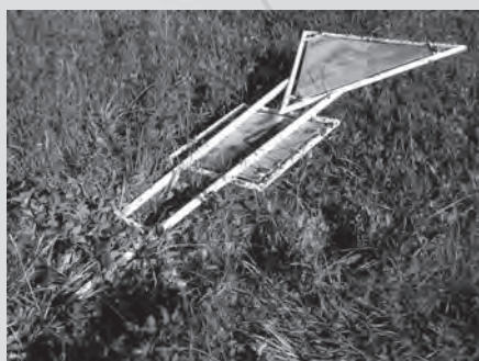
Zničit dopravní značku Dej přednost v jízdě zavání obecným ohrožením