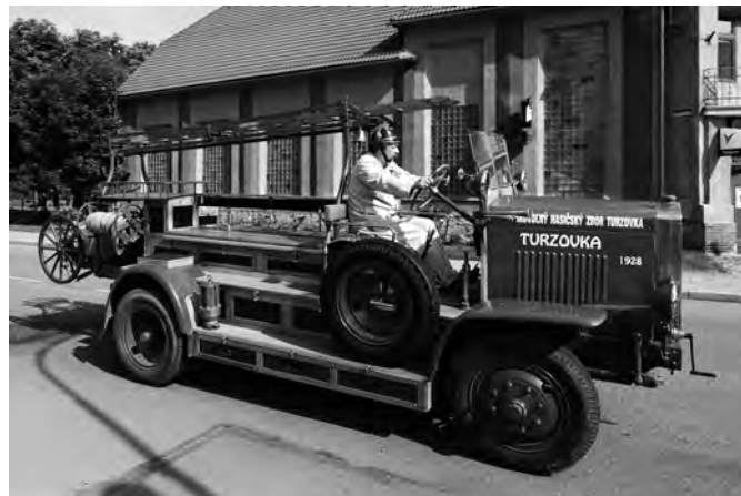
S historickou stříkačkou přijeli pozdravit své kolegy hasiči z Turzovky