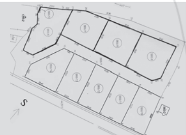
Tučně ohraničené jsou pozemky určené k prodeji