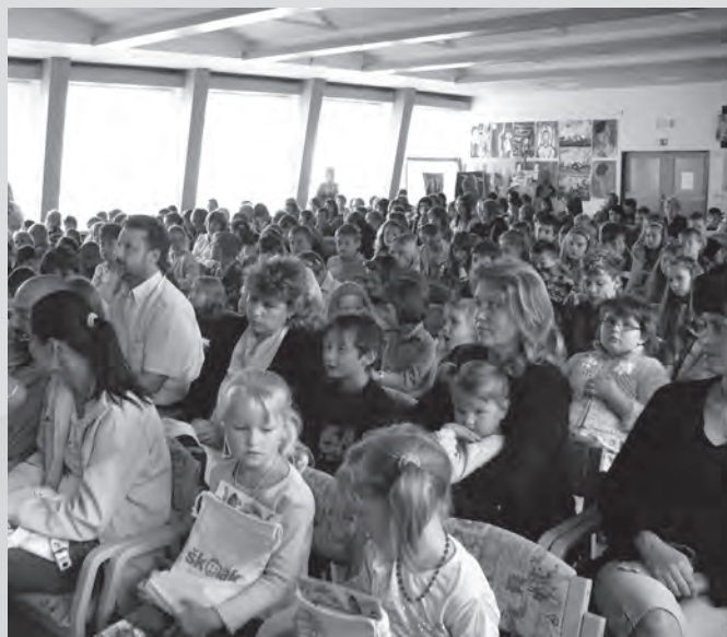
Zaplňený sál základní umělecké školy při slavnostním zahájení nového školního roku