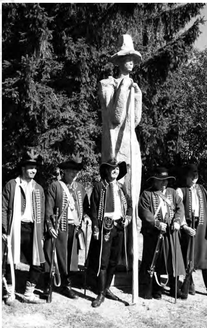
Strážci valašských hranic portáši u sochy Božka Zemana Pocta Valachům

Soláň a umělci - to vždy patřilo k sobě. Krásné prostředí Beskyd a slunečné počasí přilákalo v sobotu 13. září nejen výtvarníky, ale i náhodné kolemjdoucí. Návštěvníci Soláně vytvořili příjemnou atmosféru, ve které proběhla národopisná slavnost s názvem Soláň 2008 – babí léto na Soláni. Ta byla plná hudby, tance i výtvarného umění.