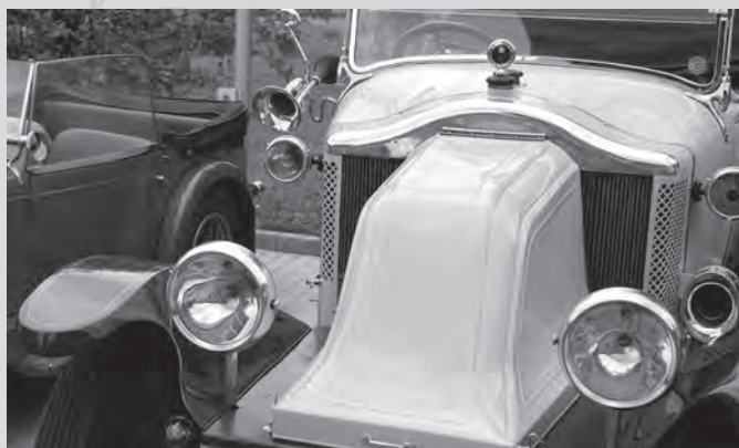
Detail jednoho z nejstarších účastníků, veterána Renault