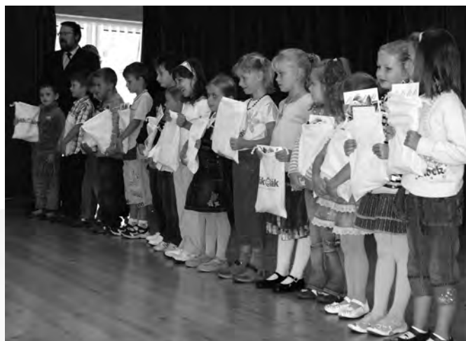
Přivítání prvňáčků na zahájení nového školního roku