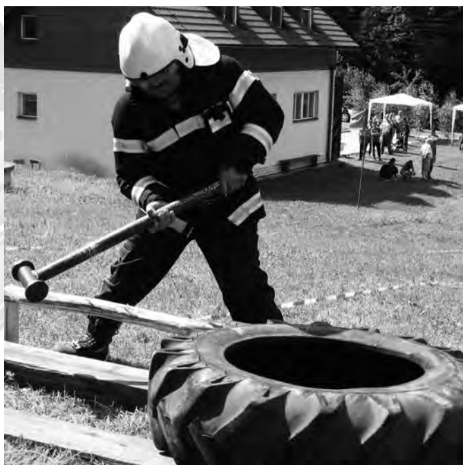
Disciplína pro celé chlapy - posunování závaží pomocí kladiva

Pod tímto názvem proběhl poslední červnový víkend u hasičského domu ve Stanovnici jako součást hasičského dne první ročník mezinárodní soutěže hasičů v disciplínách TFA.