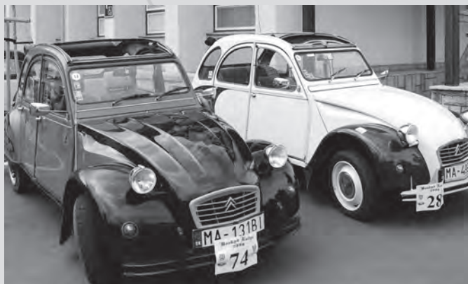
Dvakrát ošklivá kachna - Citroën 2CV