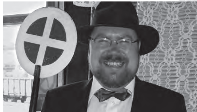
K odjezdu historického vlaku dal povel dobově upravený starosta