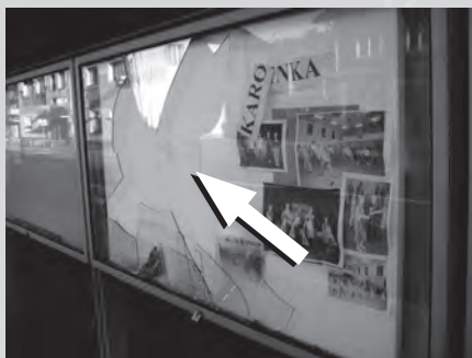
Skleněná výplň jedné z nástěnek u Sokolovny nevydržela test hozeným kamenem