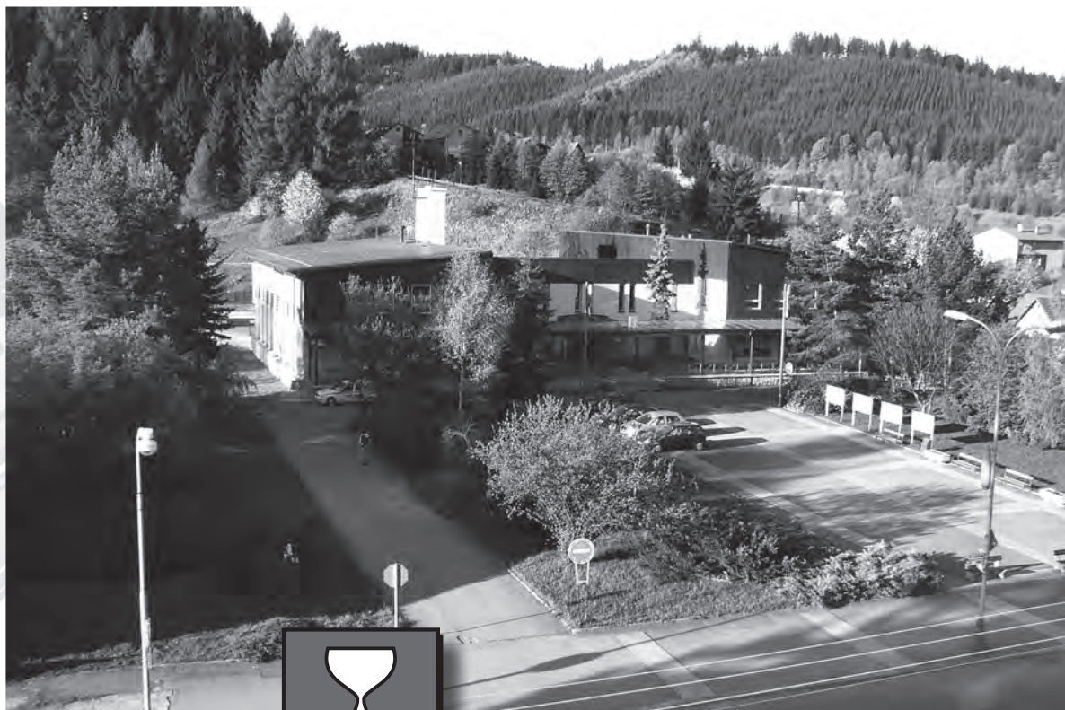
Náměstí v Karolince, jak jsme ho znali do loňského roku