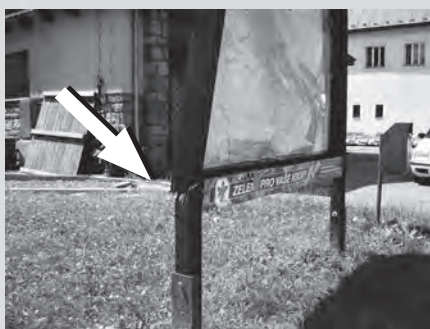
Této turistické mapě pomohli pro změnu karolínští hasiči