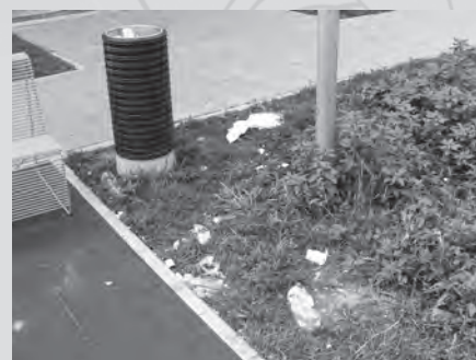
Někteří lidé se prostě do odpadkového koše netrefí