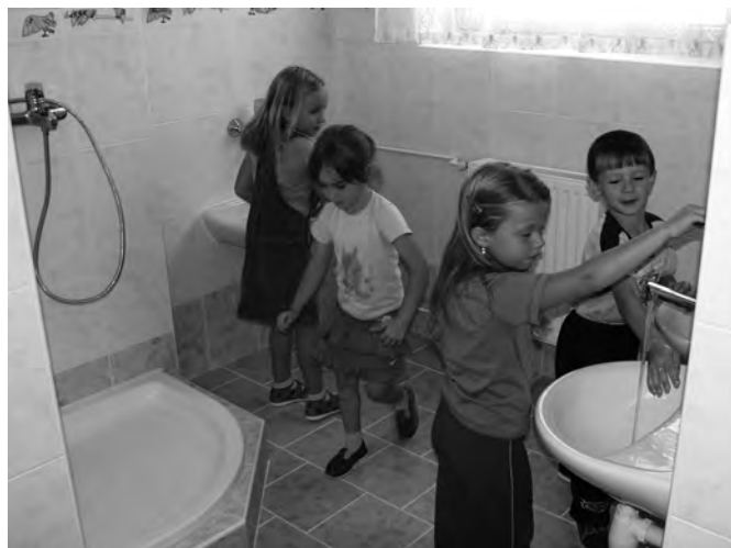
Nová sociální zařízení v mateřské školce se dětem velice líbí