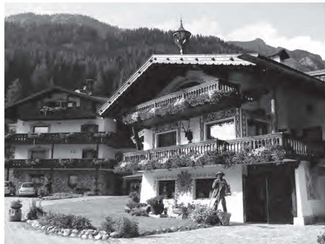
Klasická tyrolská architektura - to je severoitalská Sappada

V nedávné době informovalo Sdružení Valašsko – Horní Vsacko o připravované spolupráci s italskými reprezentanty v běžkařském sportu. Tato spolupráce má od 12. července tohoto roku hmatatelnou podobu ve formě podepsané smlouvy o vzájemné spolupráci.