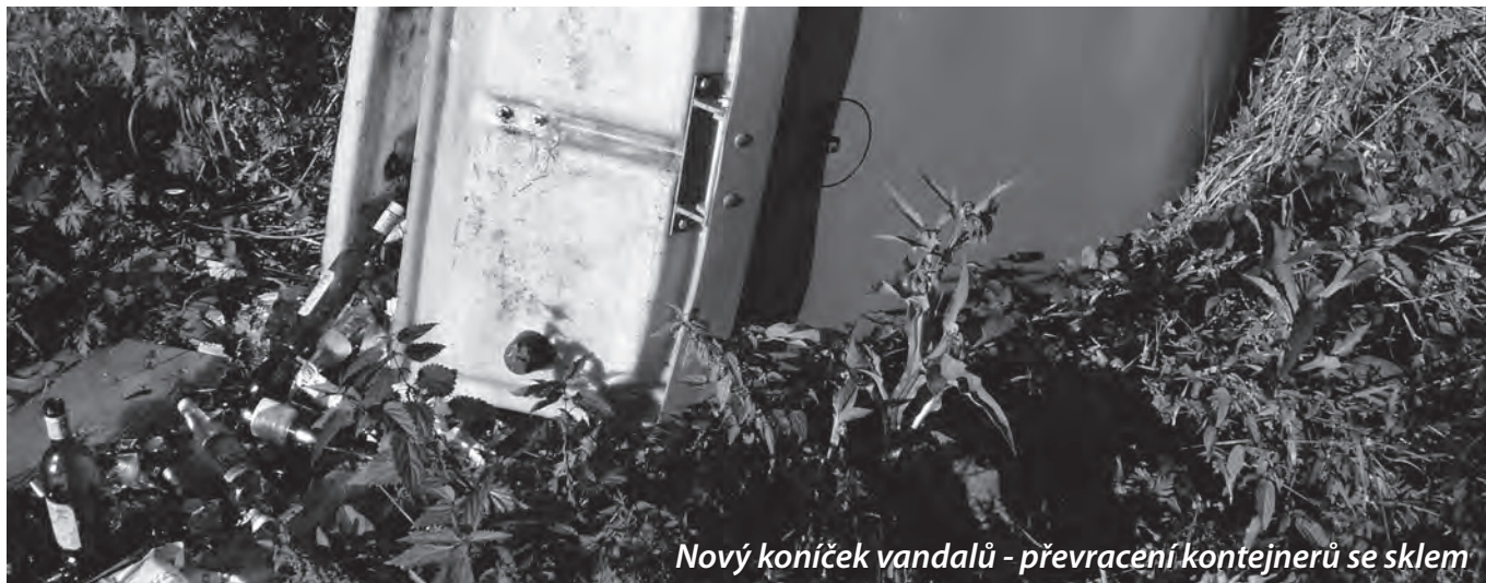
Nový koníček vandalů - převrácení kontejnerů se sklem

Náš nekonečný příběh, ve kterém upozorňujeme na škody, které na obecním majetku průběžně působí vandalové, se v uplynulém období dočkal několika pokračování, která můžete vidět na fotografiích.