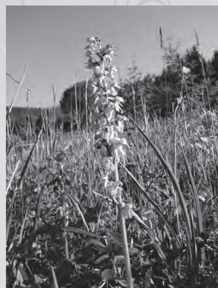
Na Valašsku ohrožený druh - Vstavač mužský