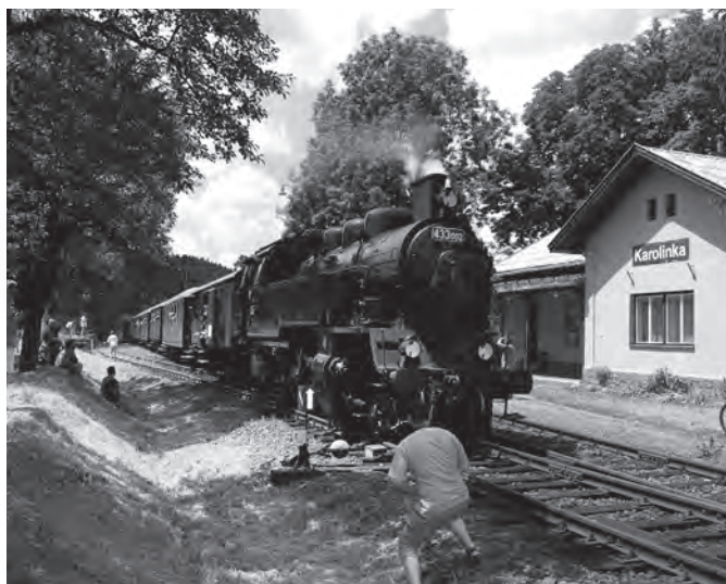
Historický parní vlak v karolinském hlavním nádraží