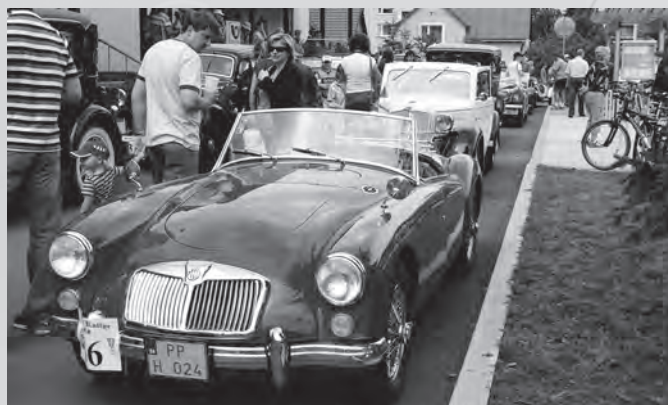
Velkou pozornost poutalo i sportovní kupé značky MG