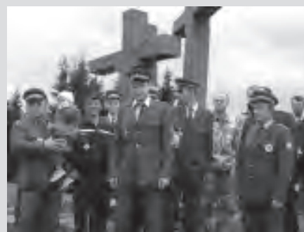
Momentka z pietního aktu na Ztracenci.