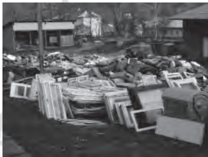
V době jarního sběru odpadů to v areálu bytového podniku vypadalo opravdu velmi zajímavě.

Všichni jistě pochopí, že tyto prostředky je nutno investovat. Ale mnohdy jsme sami proti sobě. Uvedu jeden markantní příklad. Již v některém z předešlých Zpravodajů jsem Vás informoval o tom, jaký je rozdíl mezi elektroodpadem a tak zvaným zpětným odběrem elektromateriálů a spotřebičů. Jen krátce zopakuji. Neporušené, i když opotřebované lednice, televizory, počítače atd., jsou brány jako zpětný odběr a jsou odebírány zdarma. Jestliže však „domácí kutilové“ z lednice odmontují motor, z televizoru některé jeho součásti a potom nám to dovezou na dvůr, je to považováno za elektroodpad a za jeho likvidaci se platí. A to nemalé částky. Například za likvidaci jedné tuny takto neúplných spotřebičů zaplatíme téměř pět tisíc korun a ještě dopravu na místo likvidace. A musím upozornit, že v Karolince (a asi nejen v Karolince) je těch neúplných spotřebičů drtivá většina. Takže za ně platíme vlastně dvakrát. Protože v ceně při jejich koupi platíte tak zvaný příplatek za likvidaci a potom po letech, když se věci zbavujete, platíme všichni za likvidaci znovu.