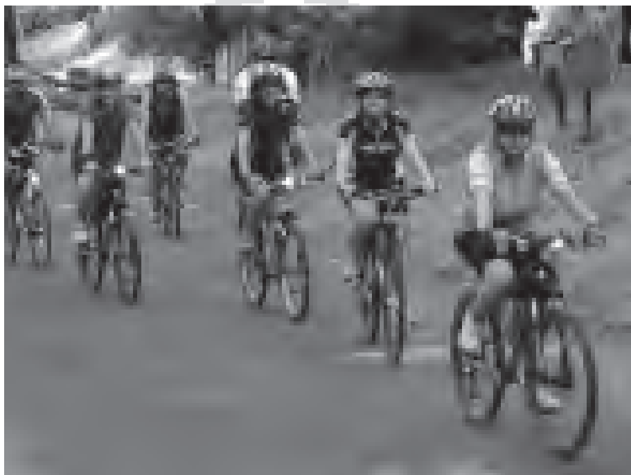
Tuto skupinu cykloturistů jsme zachytili kousek pod Ratkovským šenkem.

(z podkladů mikroregionu Valašsko – Horní Vsacko)