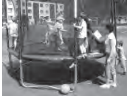
Nějtěžší atrakcí revitalizovaného sídliště Na Nábřežní byla trampolína - než ji zničili vandalové.

ky. Zážitek to byl velmi silný a dobrodružný, ze strany dětí bylo potřeba hodně odvahy a odhodlání. Také následné fotografování dětí bude jednou vzpomínkou na společné chvíli s malými kamarády ve školce.