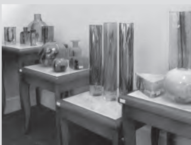
Několik překrásných artefaktů, které můžete najít v galerii Charlotta.