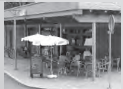
K příjemnému posezení zve nově otevřená kavárna Alfa na Radničním náměstí.

Na vaši návštěvu se těší personál kavárny.