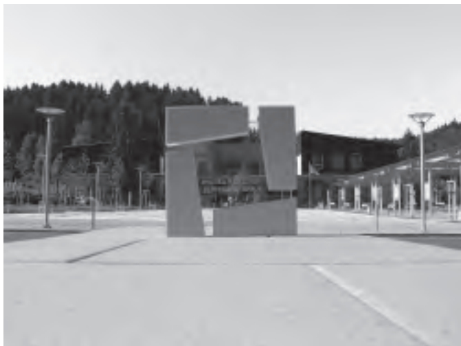
Pohled na nové náměstí přes plaketu s oceněním Stavba roku.

Za třešničku na dortu je pak možno považovat další ocenění Radničního náměstí, a tím je prestižní Cena Syndikátu novinářů ČR Zlínského kraje, který rovněž naše náměstí ocenil jako stavbu roku 2007 Zlínského kraje.