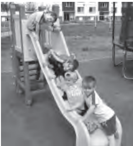
Děti z mateřské školy při vycházce nevynechají ani skluzavku na sídlišti Na Nábřežní.