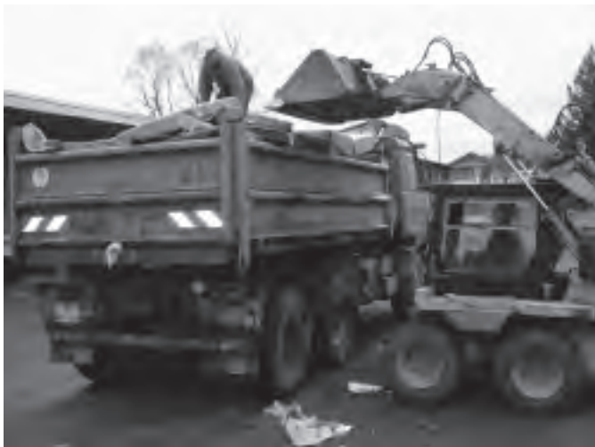
Vytříděný odpad byl rozvezen na skládky a do firem, které se likvidací odpadů zabývají.

Jelikož toto je první vydání Zpravodaje od doby, kdy v našem městě proběhla akce na sběr objemného a nebezpečného odpadu, chci Vás informovat o tom, jak tento jarní sběr probíhal a dotknout se okrajově i obecných pravidel, které by měl každý občan ctít.