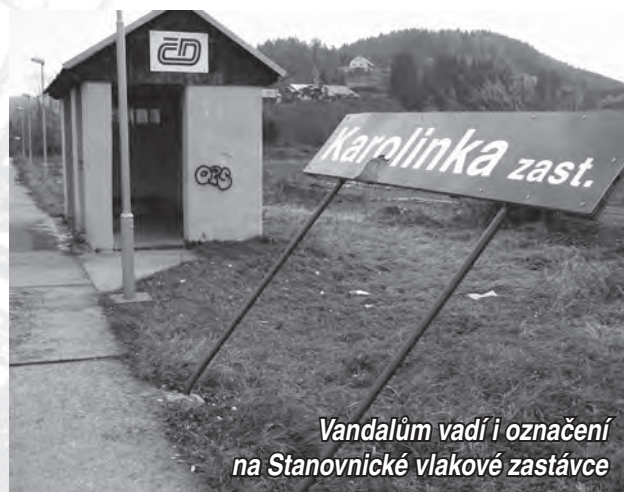
Vandalům vadí i označení na Stanovnické vlakové zastávce

Ani toto číslo Zpravodaje se neobejde bez příspěvků, kterými nás pravidelně v našem městě zásobují vandalové. Tentokrát si vzali na paškál označení stanovnické vlakové zastávky, které, když už se jim ho nepodařilo zcela vyvrátit, tak jej alespoň ohnuli.