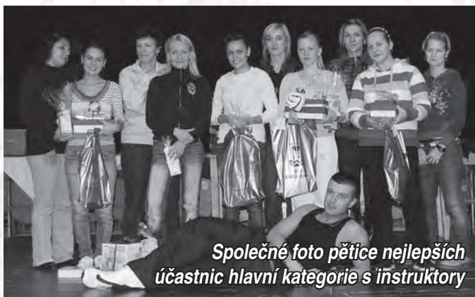
Společné foto pětice nejlepších účastnic hlavní kategorie s instruktory

zemí Valašského národního divadla a bez jejíž vstřícnosti bychom tuto akci nemohli