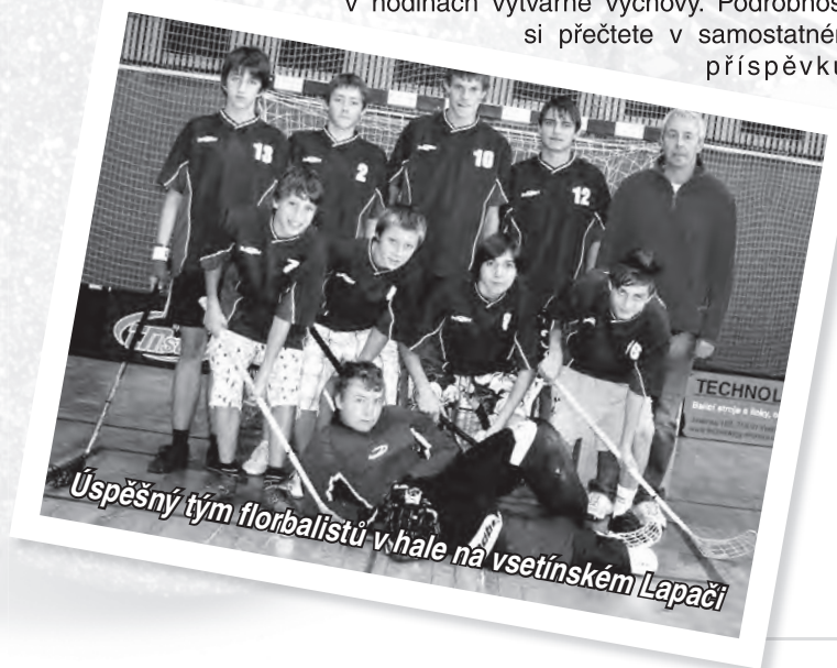
Úspěšný tým florbalistů v hale na vsetínském Lapáci