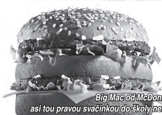
Big Mac od McDonald's asi tou pravou svačinkou do školy nebude

Svačí vaše dítě ve škole? A víte co? První desítky škol se v České republice přihlásily k účasti na projektu Svačiny do škol. Děti tak dostanou zdravou svačinu přímo do třídy, aniž musí mít u sebe peníze a rozhodně ji nezhodí do koše – samy si ji totiž objednají na internetu, podle své chuti.