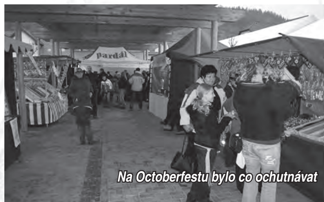
Na Octoberfestu bylo co ochutnávat