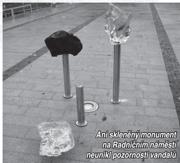
Ani skleněný monument na Radničním náměstí neunikl pozornosti vandalů

Druhým terčem se stal trojdílný skleněný monument na Radničním náměstí, jehož jednu část se vandalům podařilo ulomit. Naštěstí se skleněný odlitek nerozbil, a mohl být po přilepení nosné části opět instalován na místo. Vzhledem ke skutečnosti, že je na několika místech lehce rozpraskaný však hrozí, že při zimních mrazech dojde k jeho nenávratnému poškození.