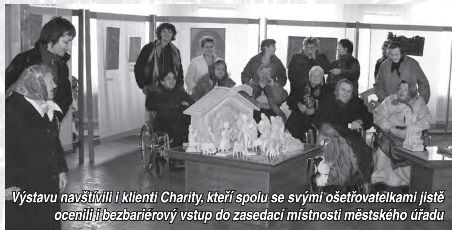
Výstavu navštívili i klienti Charity, kteří spolu se svými ošetrovatelkami jistě ocenili i bezbariérový vstup do zasedací místnosti městského úřadu