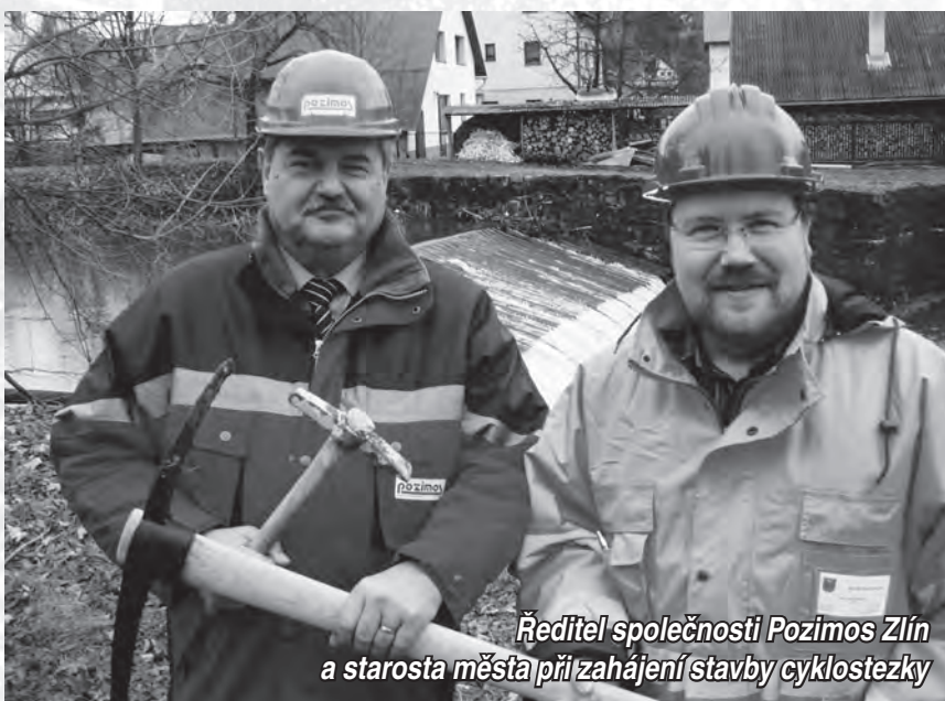
Ředitel společnosti Pozimos Zlín a starosta města při zahájení stavby cyklostezky

S příchodem nového roku všichni vyčkáváme navýšení nákladů spojených s provozem našich domácností, proto bych se také zmínil o cenách svozu a likvidace komunálního odpadu, dále vodného a stočného v Karolince pro rok 2010. Cena za komunální odpad v příštím roce zůstává ve stejné výši, tj. 500 Kč na obyvatele a rok, i když celkové náklady jsou vyšší a město hledá jak z rozpočtu dorovnat zbývající část. Cena vodného a stočného se bohužel mírně navýšila a je na příští rok stanovena následovně: