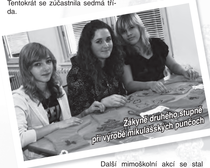
Žákyně druhého stupně při výrobě mikulášských punčoch

Žijeme i kulturou. Soutěžní klání Sedmihlásek v sólovém zpěvu