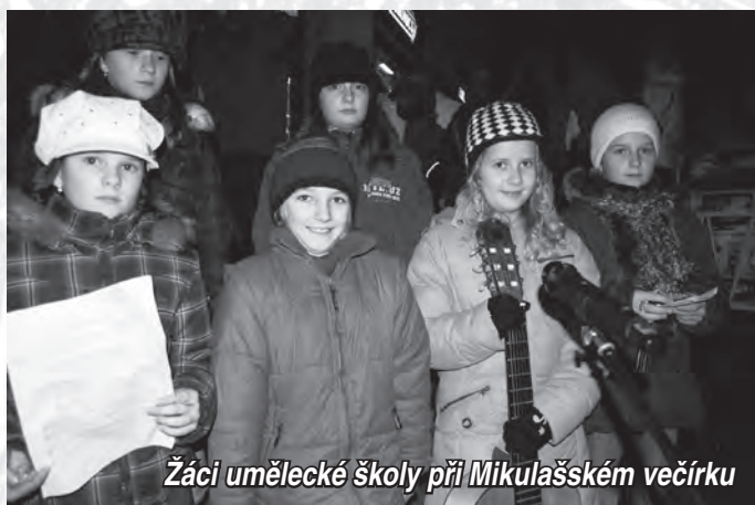
Žáci umělecké školy při Mikulášském večerku