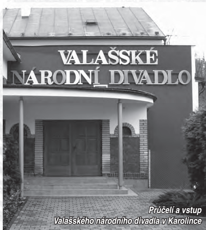
Průčelí a vstup Valašského národního divadla v Karolince

předpovídá rychlý vzestup, ale brzkou smrt. Naproti tomu druhý bratr Lološ je naprostý outsider. Právě přišel o místo pojišťováka a v životě se mu nic nedaří. Podle hvězd má úspěšný bratr za nedlouho zemřít, zatímco smolař bude mít život dlouhý. To způsobí, že si náhle nešťastník Lološ začne svých neúspěchů „nepochopitelně“ vážit a zuřivě se brání štěstí. Lásky jedné slečny může ale všechno změnit. Hrají: J. Carda/V. Limr, A. Procházka,