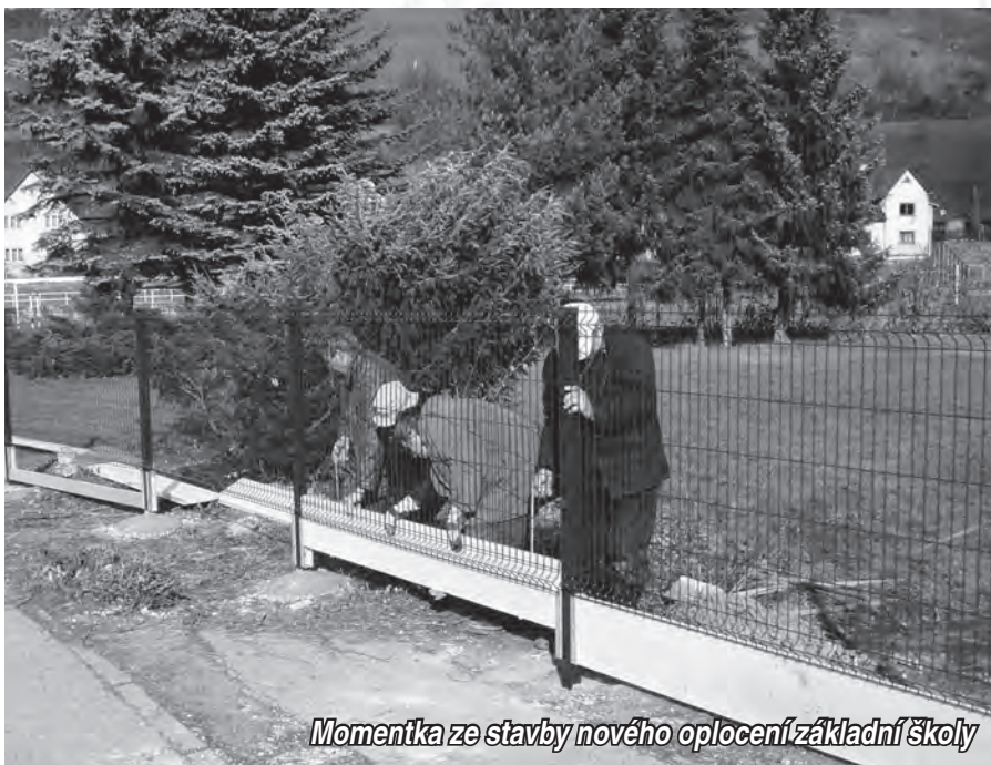
Momentka ze stavby nového oplocení základní školy

Výběrovým řízením byl jako dodavatel vybrán Městský bytový podnik Karolinka. Podle zadávacích kritérií byla nová část oplocení provedena ze svařovaných poplastovaných panelů, připevněných na ocelových sloupcích a opatřena podhrabovými betonovými deskami. Současně oplocení je i nová uzamykatelná vstupní brána pro vjezd do parkoviště před