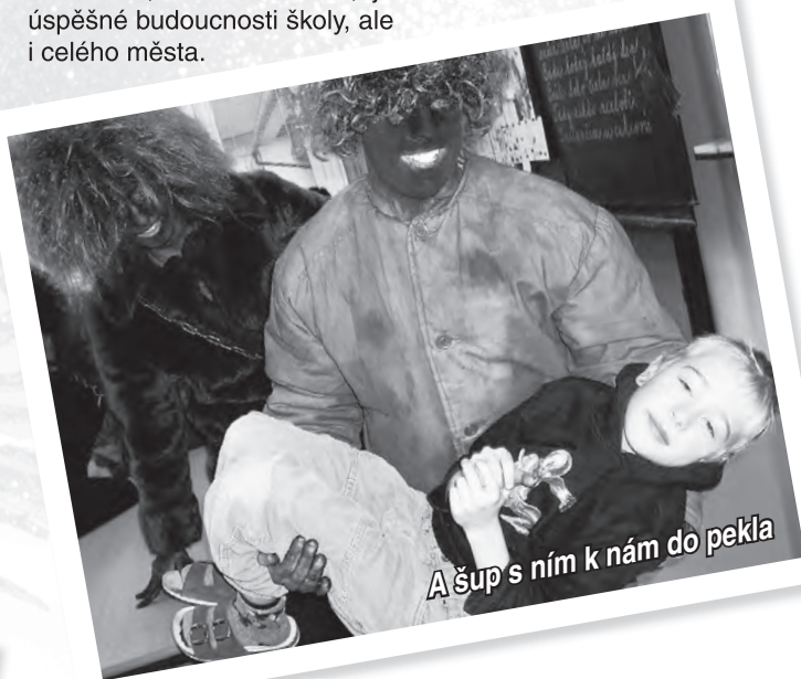
A šup s ním k nám do pekla

Vyučování stále častěji doplňují a v konečném výsledku obohacují komplexní programy pro děti, tématicky zaměřené projekty. Největší podzimním se stal projekt Vánoce. V pracovních dílnách během jednoho vyučovacího dne vyrobili účastníci adventní věnce, ozdobné svíčky, perníčky, či přáníčka. Žáci z prvního stupně se výrobou přání a ozdob s motivy Vánoc zabývali v hodinách výtvarné výchovy. Podrobnosti si přečtete v samostatném příspěvku.