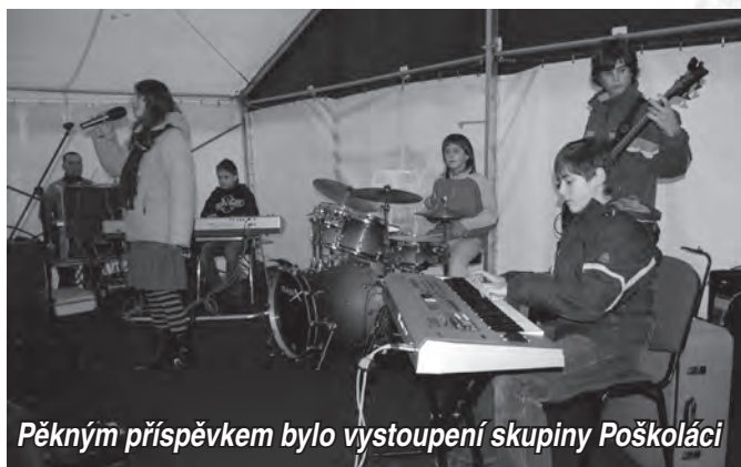
Pěkným příspěvkem bylo vystoupení skupiny Poškořáci

Zajímavou akci připravilo pro občany vedení města začátkem listopadu, kdy se na Radničním náměstí odehrál první ročník Karolinského pivního Octoberfestu.