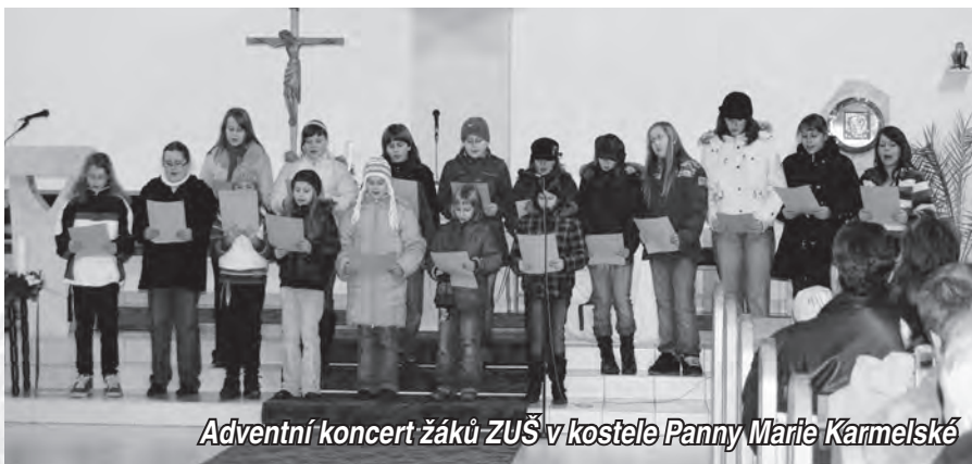
Adventní koncert žáků ZUŠ v kostele Panny Marie Karmelské

ZUŠ Karolinka uspořádala v podzimních měsících celou řadu akcí. Ať už to byl podzimní koncert, koncerty Poškoláků, dopoledne soutěží a her pro ZŠ Turkmenská Vsetín, vernisáž výstavy výtvarného oboru s názvem Vesmír nebo představení literárně dramatického oboru S princeznami to není lehké pro žáky základních škol.