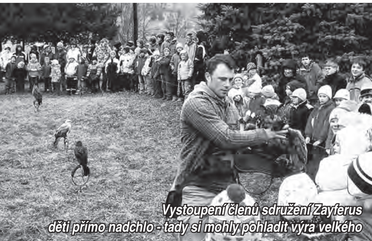
Vystoupení členů sdružení Zayferus děti přímo nadchlo - tady si mohly pohladit výra velkého

Plot kolem školy nevyrostl proto, abychom se před ostatní Karolinkou uzavřeli. Je to jen opatření, jež má zamezit neustálému nepořádku a vandalství části nevitáných návštěvníků před budovou. Jejich činnost dlouhodobě maří snahu vedení města o Karolinku co nejpěknější. Příkladná spolupráce s naším zřizovatelem, MěÚ Karolinka, je zárukou další úspěšné budoucnosti školy, ale i celého města.