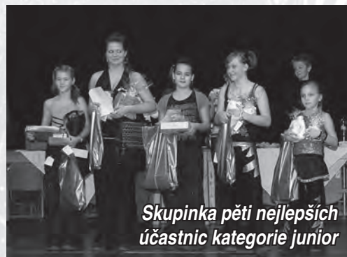
Skupinka pěti nejlepších účastnic kategorie junior

uspořádat. Naše tělocvična k tomu totiž není přizpůsobena a bohužel, možnost získání nemalých finančních prostředků na její rekonstrukci byla pro nesouhlas některých členů naší jednoty promarněna.