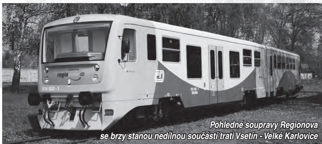
Pohledné soupravy Regionova se brzy stanou nedílnou součástí trati Vsetín - Velké Karlovice