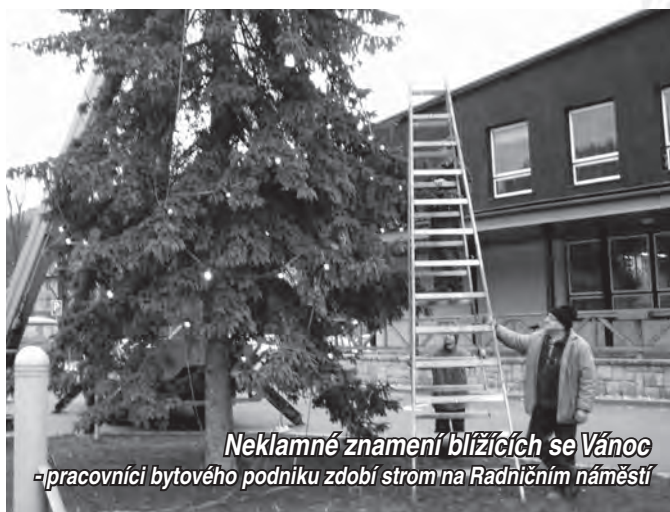
Neklamné znamení blížících se Vánoc - pracovníci bytového podniku zdobí strom na Radničním náměstí

V letošním roce postihly finanční potíže také rozpočet města Karolinka. V současné době činí výpadek na daních 3 mil. Kč a odhadujeme, že se do konce roku navýší na 4 mil. Kč. Pro Vaši představu tato částka odpovídá celkové výši investic v letošním roce, ty se letos financovaly z posledních rezerv města. Z tohoto důvodu bude hospodaření našeho města v příštím roce mnohem složitější, návrh rozpočtu pro rok 2010 počítá s položkou na investice v nulové výši. Budeme rádi, kdybychom ustáli výdaje na běžný chod města bez dalších půjček. V případě, že se podaří získat nějaké dotace, budeme si muset na financování vyřídit úvěr.