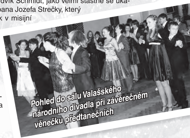
Pohled do sálu Valašského národního divadla při závěrečném věnečku předtanečních

Pro žáky 6. — 8. tříd už není Yukon abstraktní pojem a také Filipíny nejsou jen barevná skvrna na mapě.