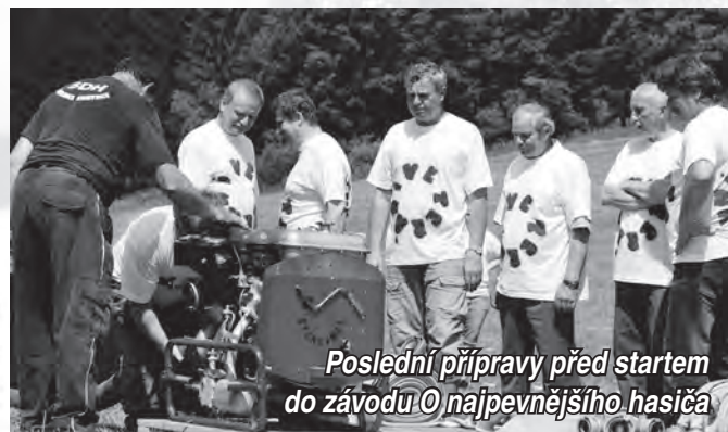
Poslední přípravy před startem do závodu O nejpevnějšího hasiča