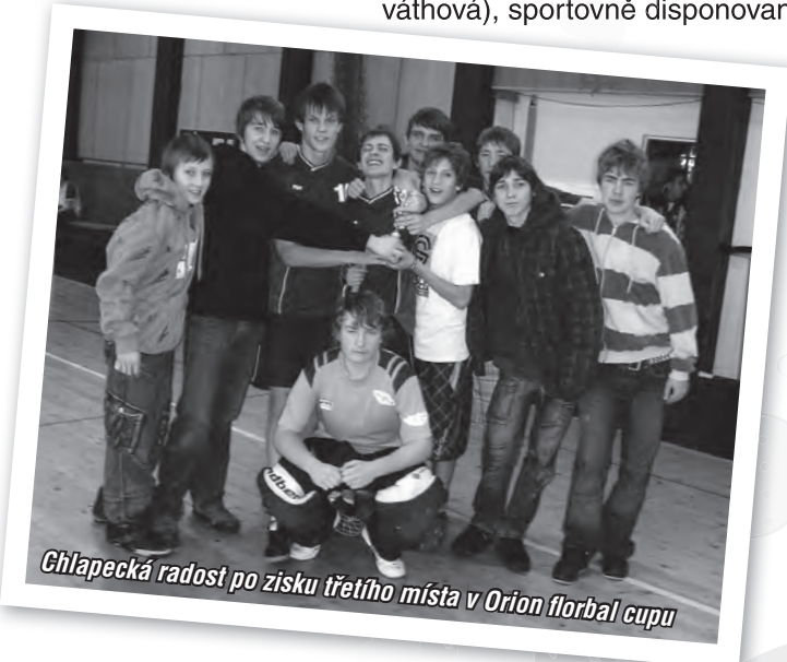
Chlapecká radost po zisku třetího místa v Orion florbal cupu

chlapce přilákal Orion Florbal Cup (v okresní konkurenci tentokrát výkony našich stačily na 3. místo), zájemci o lyžování ze 7. - 9. tříd vyrazili po jarních prázdninách na karolinskou sjezdovku.