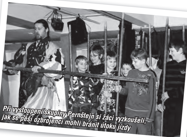
Při vystoupení skupiny Pernštejn si žáci vyzkoušeli, jak se pěší ozbrojenci mohli bránit útoku jízdy

Dlouhodobá příprava na Velký dětský karneval vyvrcholila 27. února v sále Valašského národního divadla. Výroba plakátů, shánění sponzorů a výzdoba sálu měly lví podíl na tom, že program připravený Alcedem Vsetín a bohatá tombola všechny příchozí jako obvykle nezklamaly.