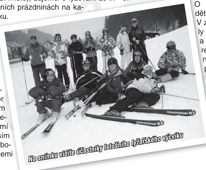
Na snímku vidíte účastníky letošního lyžařského výcviku

To už (alespoň pro začátek) nebyla soutěž, ale regulérní lyžařský výcvik. Tým instruktorů Skiareálu Karolinka ukazoval směr méně zdatným a korigoval přehnané sebevědomí těm zkušenějším lyžařům a snowboardistům. Nad všemi