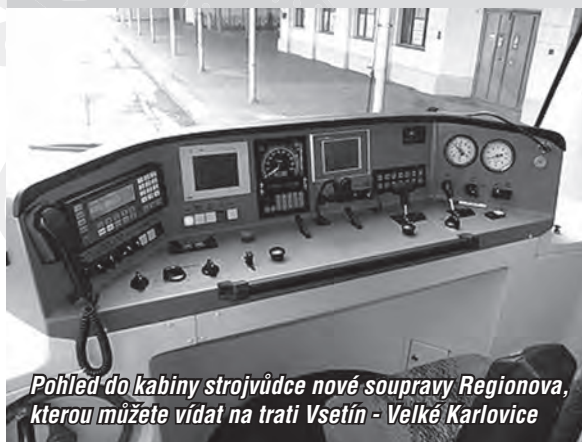
Pohled do kabiny strojvůdce nové soupravy Regionova, kterou můžete vidat na trati Vsetín - Velké Karlovice

Na lince 940023 (Stanovnice) došlo v souvislosti s výše uvedenou změnou k pozdějšímu odjezdu spoje č. 9 ze Vsetína. Spoj odjíždí od 8. března z autobusového nádraží až ve 14.50 hod. (dříve ve 14.40 hod.) a stejně opožděn je samozřejmě po celé trase do Stanovnice (tam příjezd v 15.50 hodin).