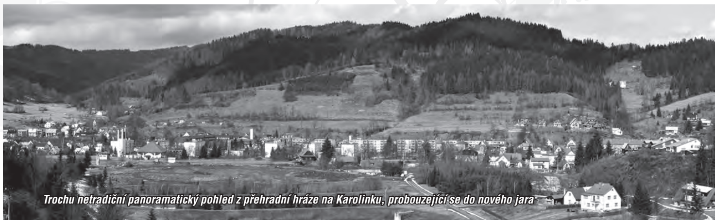
Trochu netradiční panoramatický pohled z přehradní hráze na Karolinku, probouzející se do nového jara

V pátek 12. března proběhlo veřejné projednávání projektu regenerace sídliště Na Horebečví. Po revitalizaci sídliště Na Oboře a Nábřežní město pokračuje s regenerací dalšího sídliště Na Horebečví. Bohužel již nelze na tento projekt získat finanční prostředky z Ministerstva místního rozvoje, jak se to podařilo v minulosti. Proto se pokoušíme zpracovat projekt na podmínky vypsání krajským úřadem z regionálního operačního programu. Odhadované náklady na regeneraci toho sídliště jsou 18 milionů korun, ale podmínky umožňují podat projekt do max. výše 14 milionů. Proto budeme muset projekt upravit a doufat, že se podaří získat tuto dotaci. V opačném případě bychom z finančních důvodů letos tuto akci nemohli zahájit.