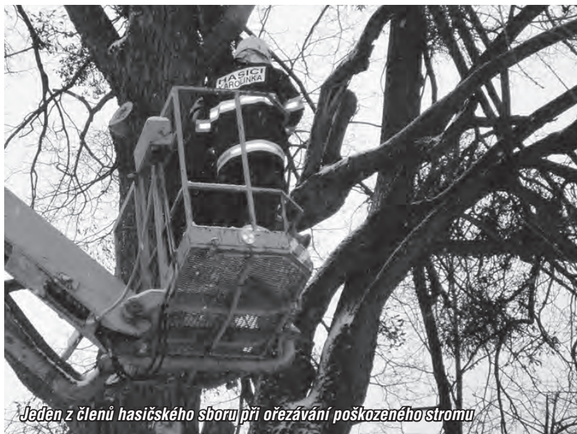
Jeden z členů hasičského sboru při ořezávání poškozeného stromu

Výjezdová jednotka sboru plně využívá období s nízkým počtem zásahů k údržbě a opravám techniky, která již není nejnovější. Z hlediska akceschopnosti bylo nejdůležitějším úkonem zavaření cisterny na podvozku T 815, která začátkem roku prorezavěla. Odstávky tohoto vozidla bylo využito rovněž k opravě brzdového systému s kompletní výměnou brzdového obložení. Tatáž oprava byla provedena taky na druhé cisterně na podvozku T 148.