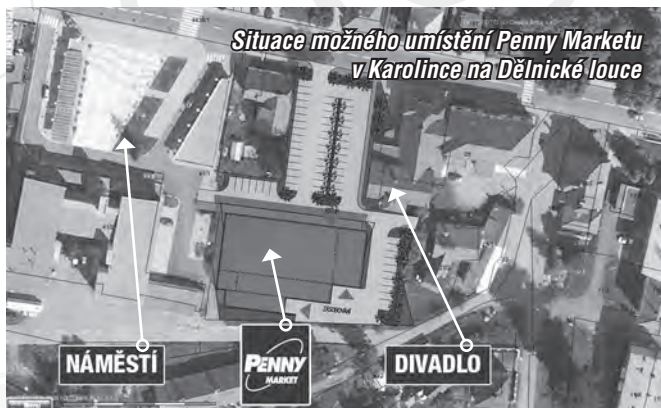
Situace možného umístění Penny Marketu v Karolince na Dělnické louce

S ohledem na probíhající jednání se v současnosti jeví pravděpodobné, že uvedený supermarket bude stát v prostoru tzv. Dělnické louky. Pro upřesnění předkládáme čtenářům situační plánec tohoto prostoru, kde je již supermarket včetně souvisejícího parkoviště zakreslen. Kromě samotného umístění však projekt také zohledňuje několik urbanistických hledisek, kterým je například pěší propojení náměstí vytvořením náznaku nové ulice - korza se souborem staveb, tvořených Valašským národním divadlem, penzionem Sklář a bývalou Hutí Charlotta.