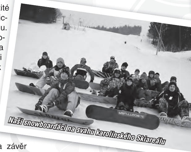
Naši snowboardáři na svahu karolinského Skiareálu