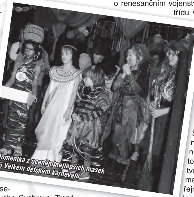
Momentka z ocenění nejlepších masek při Velkém dětském karnevalu

Florbalisté toužili po dalších vítězstvích ve 3. kole okresní ligy starších žáků. Tentokrát se museli sklonit hned dvakrát, a to před uměním soupeřů z Hošťálkové