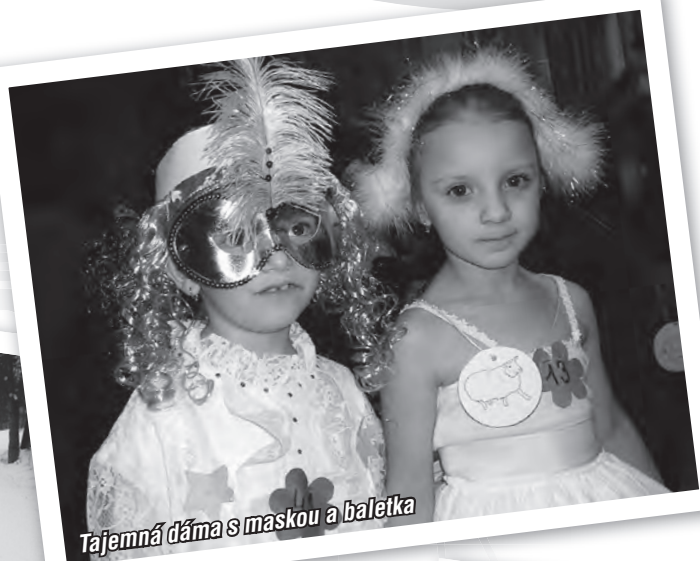
Tajemná dáma s maskou a baletka

mimořádný talent neodhalila, ale těšila se zaslouženě pozornosti fanoušků recitátorů z řad spolužáků i rodičů.