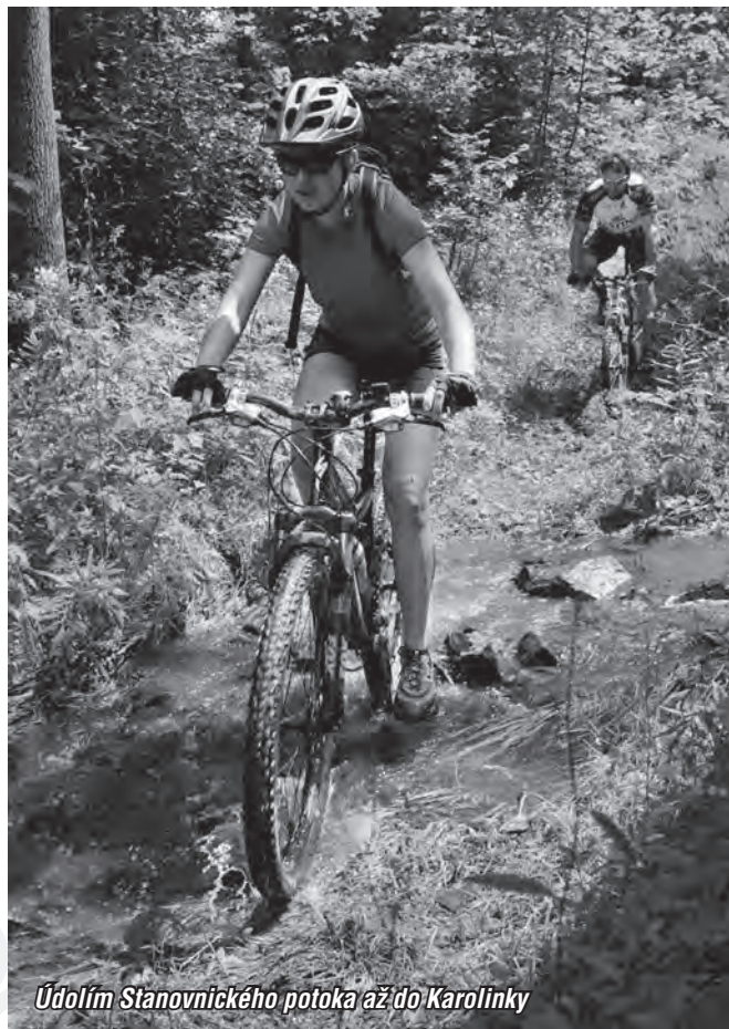
Údolím Stanovnického potoka až do Karolinky

Jedná se o projekt, který řeší systémově cykloturistiku na Valašsku. V Bike centru si budete moci půjčit či objednat kola pro celou rodinu nebo třeba jen pro sebe, zakoupit si budete moci některý z již zpracovaných cykloturistických balíčků, objednat si průvodce, který Vás zavede na neznačené trasy nebo třeba jen tak posedět a mrknout se na některý s filmů se sportovní tematikou. Realizátorem projektu by měly být neziskové organizace ze Vsetína a Rožnova pod Radhoštěm. Zájem těchto subjektů, které nejsou z Karolinky, jednoznačně ukazuje,