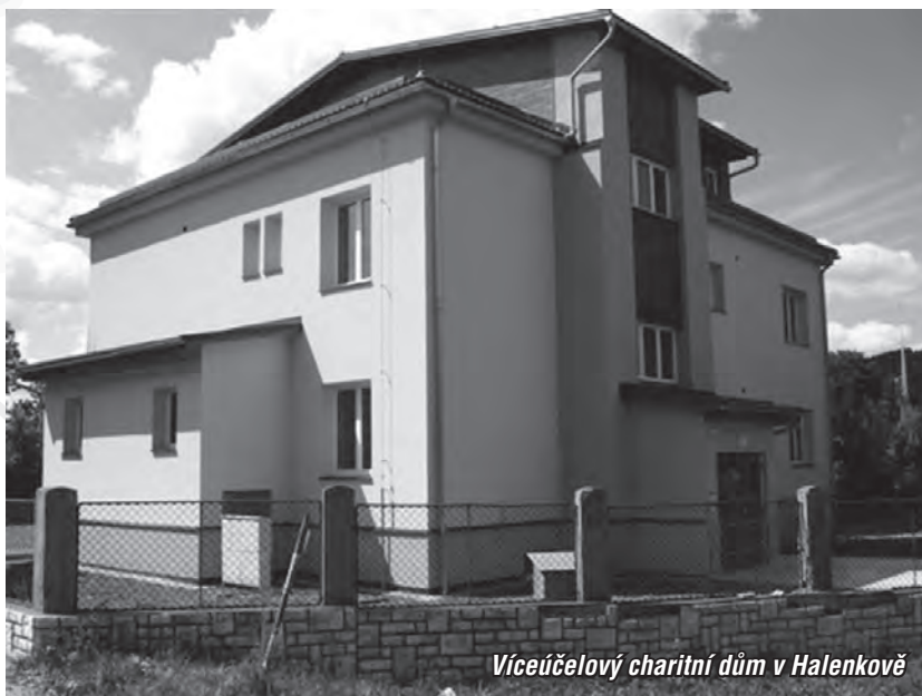
Víceúčelový charitní dům v Halenkově

polohovacích postelí, podobně vozíků a dalších pomůcek, stále přicházejí lidé žádat o další a my je už nemůžeme uspokojit. Pro příbuzné, kteří se doma starají o nemocné a ležící, jsou tyto pomůcky velkým pomocníkem. Jednou z našich sociálních služeb je také Osobní asistence pro seniory. V roce 2009 se tato služba rozrostla o další uživatele, převážně ze vzdálenějších míst v oblasti, kde se dá přijet pouze autem. Abychom mohli zajistit u těchto uživatelů službu, potřebujeme zakoupit starší auto. Proto bychom chtěli ještě část výtěžku TS vyčlenit na zakoupení auta (přibližně za šedesát tisíc korun). Všem dárcům předem děkujeme.