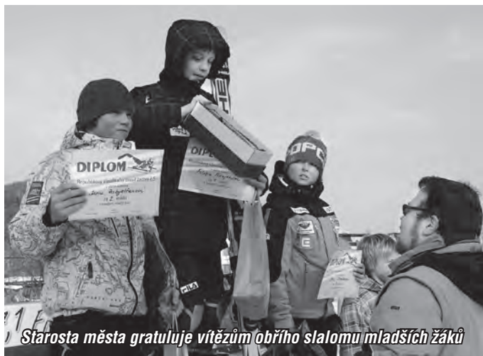
Starosta města gratuluje vítězům obřího slalomu mladších žáků

Agilní lyžařský klub Ski Soláň Rožnov byl počátkem února pořadatelem republikového klasifikačního závodu žactva ve slalomu a obřím slalomu. Dvoudenní závody proběhly ve Skiareálu Karolinka.