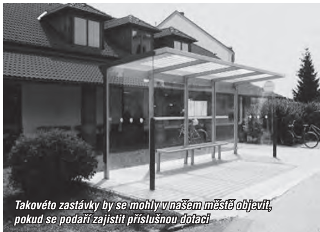
Takovéto zastávky by se mohly v našem městě objevit, pokud se podaří zajistit příslušnou dotaci

Na posledním jednání sdružení Mikroregionu Valašsko - Horní Vsacko jsme se rozhodli, že podáme v rámci sdružení žádost o dotaci na projekt realizace Varovného a výstražného systému obyvatel formou bezdrátového rozhlasu. Současný stav místního rozhlasu je ve velmi špatném stavu a rekonstrukce stojí město nemalé prostředky.