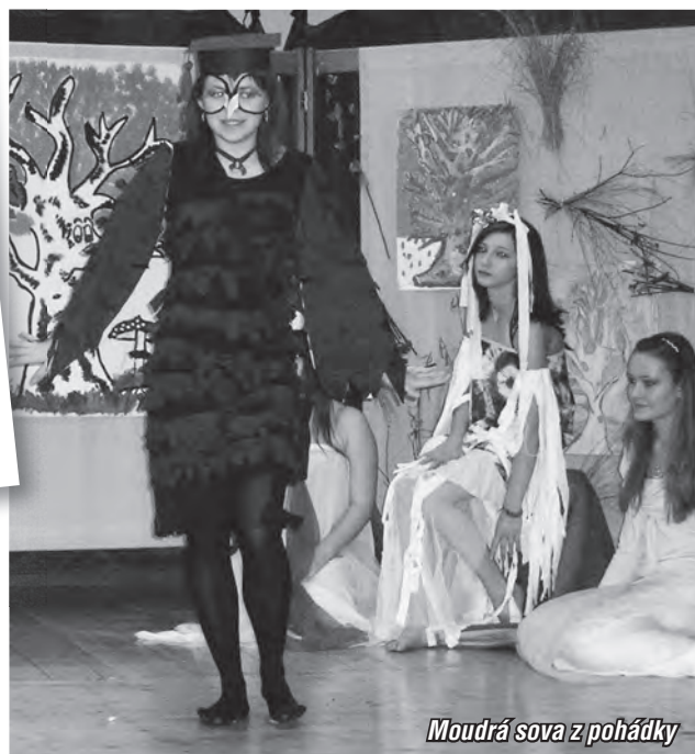
Moudrá sova z pohádky