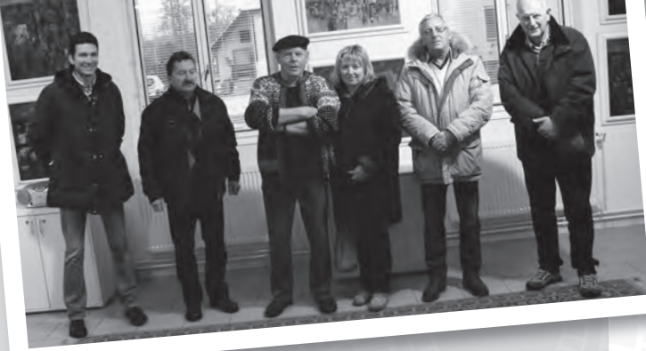
Delegace ze Sappady navštívila v doprovodu starostky a místopostarosty také ateliér mistra Hartingera

Karlovská padesátka ve stejném seriálu jako světově proslulá Jizerská padesátka a účast zmíněných italských sportovců v tomto podniku by zdůraznila prestiž regionu jako regionu sportu. V rámci setkání proběhla prezentace města Sappady v reprezentativních prostorách Vsetínských Maštalisek, kde byli pozváni zástupci samospráv, cestovních kanceláří i odborné veřejnosti. Součástí prezentace byla mimo jiné degustace gastro specialit přímo ze Sappady. Sappadany dále zajímá, jak fungují hotely, informační centra a celkové schéma cestovního ruchu v oblasti. Z tohoto důvodu byl program připraven tak, aby navštívili např. Ski Centrum Kohútka, hotel Horal, či horský hotel Portáš. Možností spolupráce je mnoho a obě strany se shodly na přípravě podrobného plánu dalších aktivit.