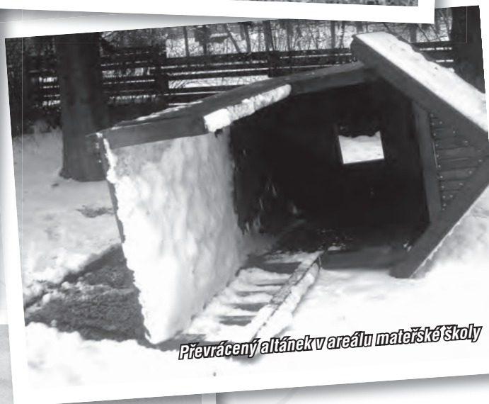
Převrácený altánek v areálu mateřské školy