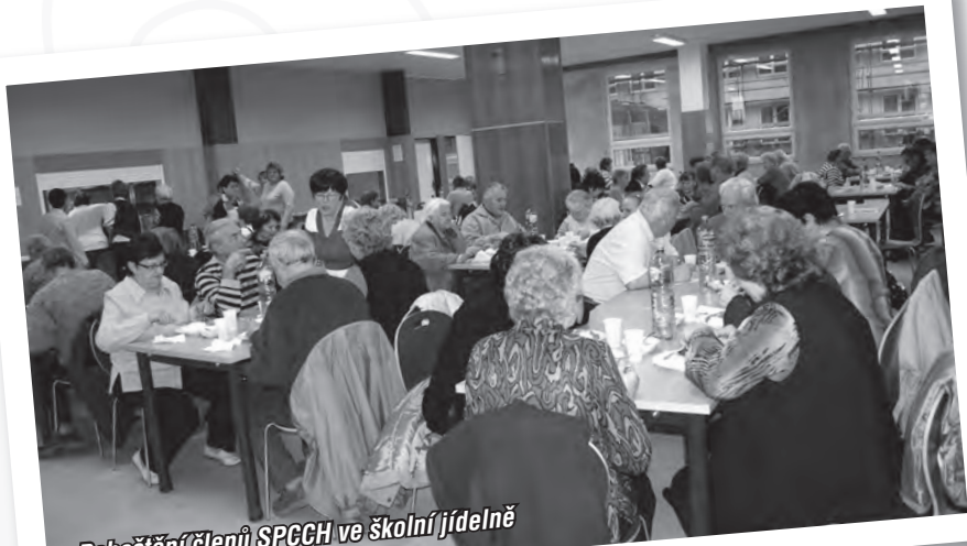
Pohoštění členů SPCCH ve školní jídelně