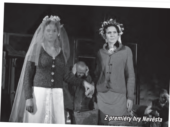
Z premiéry hry Nevěsta

Františák vede minulost i přítomnost vedle sebe, každá po svém, samostatně osnuje jedinečný pohled na určitou realitu. „Minulostní“ rovina je ryze fiktivní, byť vznikla na základě nalezených deníků a textu dodala především obraznost a poetičnost. Zatímco současnost je syrově, drsně reálná a utváří situace pevně zakotvené