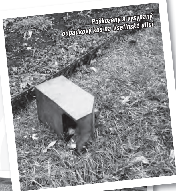
Poškozený a vyspaný odpadkový koš na Vsetínské ulici

Nekonečný seriál o vandalech, kteří ztrpčují život občanům a přidávají práci pracovníkům bytového podniku, stále pokračuje. V uplynulém období se tato individua zaměřila v několika případech na odpadkové koše (jedním z nich poškodili fasádu na domě č. 91), dokázala vyvrátit strom na Vsetínské ulici a třeba také poškodit pohybové čidlo na vstupu do Úřadu práce. K „vrcholům“ jejich činnosti pak byl stojan na kola odhozený i s kolem z mostu na ulici U Sokolovny do Bečvy a převrácený dřevěný domek a nástěnka v areálu mateřské školy. Ostatně výsledky jejich „práce“ můžete vidět na našich snímcích.