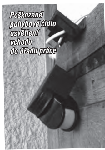
Poškozené pohybové čidlo osvětlení vchodu do úřadu práce