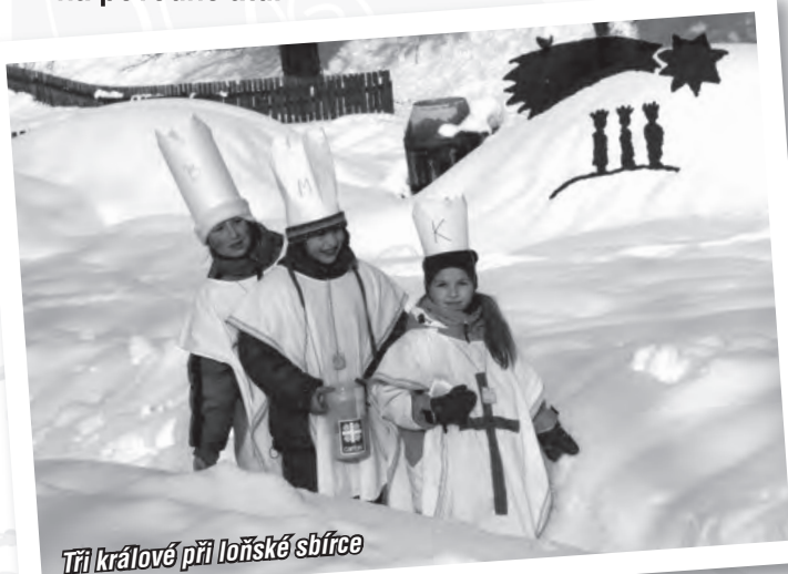
Tří králové při loňské sbírce

Snad každý se už v průběhu posledních deseti let setkal v prvních lednových dnech se skupinkou Tří králů, kteří přicházeli s pokladničkou přijímat dary na pomoc potřebným. Pomoc pak byla realizována místní či celostátní Charitou. Charita v naší oblasti využívala v minulých letech výtěžek sbírky jako jeden z více zdrojů na rekonstrukci dvou domovů pro seniory, na přímou pomoc rodinám, které se dostaly, ne vlastní vinou do nepříznivé finanční situace (nemoc, povodeň), na kompenzační pomůcky pro nemocné a dlouhodobě ležící v naší oblasti, na povodně atd.