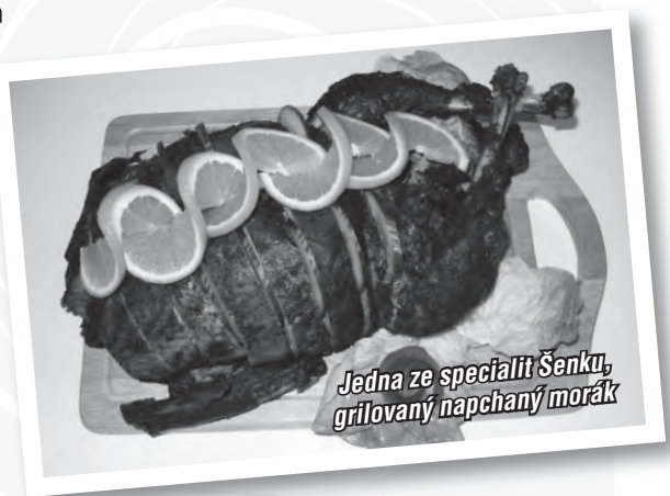
Jedna ze specialit Šenku, grilovaný napchaný morák