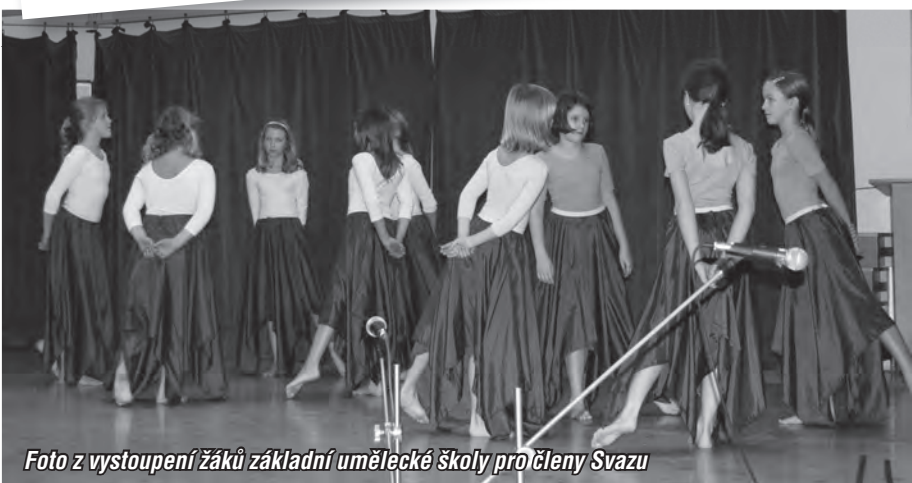
Foto z vystoupení žáků základní umělecké školy pro členy Svazu