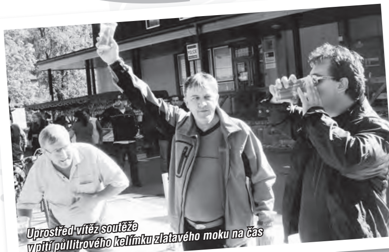
Uprostřed vítěz soutěže v pití půllitrového kelímku zlatavého moku na čas

Již podruhé připravilo Město Karolinka obyvatelům a návštěvníkům příjemné zpestření hezkého sobotního říjnového dne, a to uspořádáním dalšího ročníku karolinského pivního Octoberfestu.