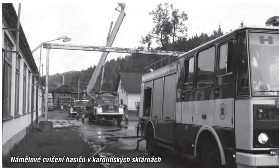
Námětové cvičení hasičů v karolinských sklárnách

Dne 8. října 2010 v odpoledních hodinách jsme pořádali celookrskové cvičení na téma Požár skladovacích prostor Karolinských skláren. Hledali jsme zraněné osoby, bylo rozvinuto několik útočných proudů a jednotky ze Stanovnice, Huslenek a Zděchova předvedly ukázkovou dálkovou dopravu vody z řeky Bečvy. Cvičení se zúčastnilo všech sedm jednotek našeho okrsku v celkovém počtu 68 mužů. Všem děkujeme za účast.