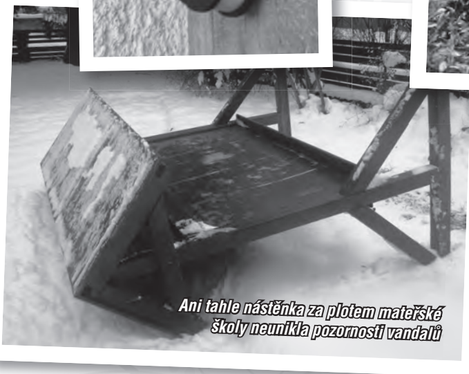
Ani tahle nástěnka za plotem mateřské školy neunikla pozornosti vandalů