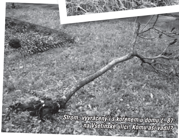
Strom, vyvrácený i s kořenem u domu č. 87 na Vsetínské ulici. Komu asi vadil?