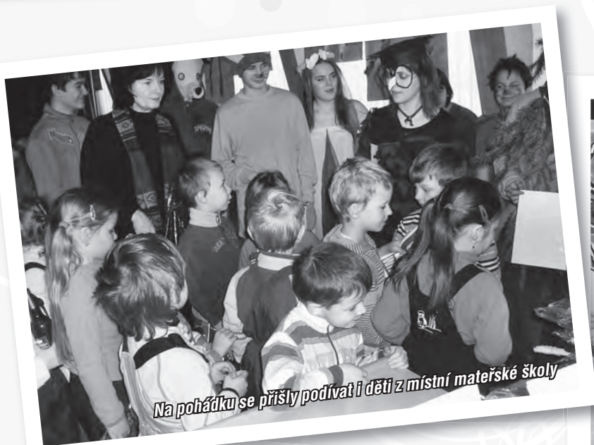
Na pohádku se přišly podívat i děti z místní mateřské školy

Sportovně zaměřeni starší žáci už opět bojují v regionální florbalové lize. V hale Na Lapači sice zatím nekralují jako v uplynulých letech, ale když už budou zase moci v domácí tělocvičně pořádně trénovat, úspěchy se jistě dostaví.