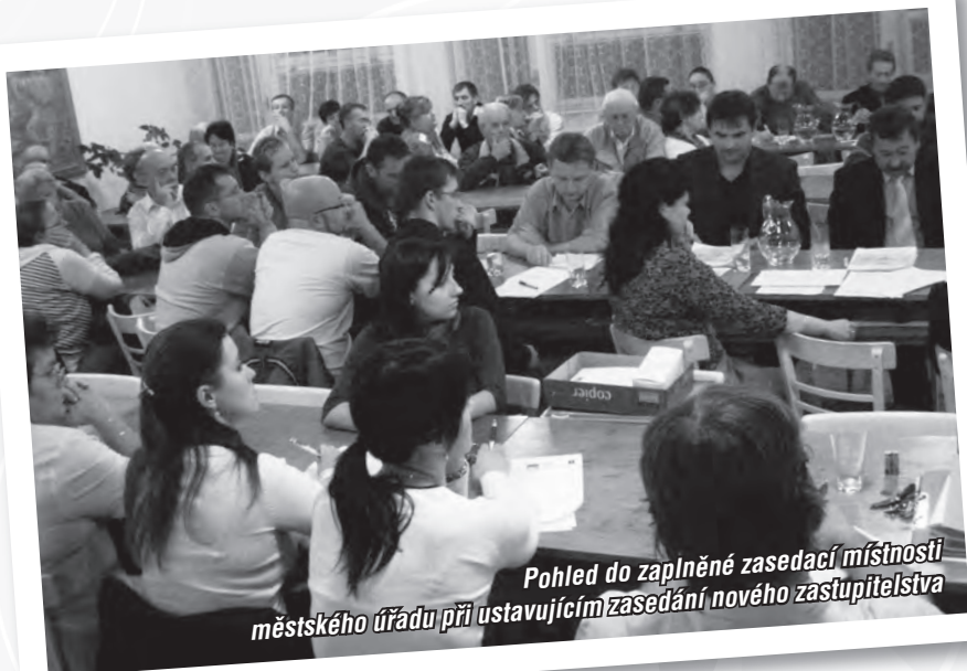
Pohled do zaplněné zasedací místnosti městského úřadu při ustavujícím zasedání nového zastupitelstva