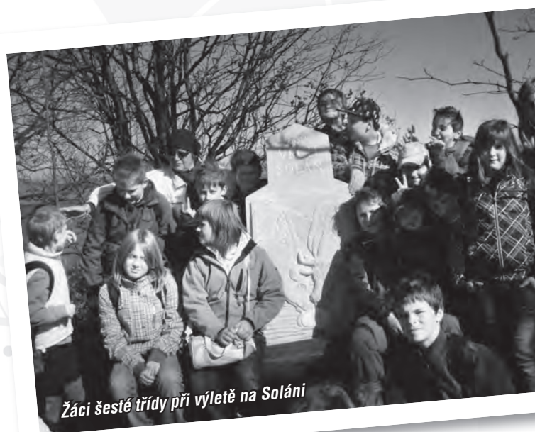
Žáci šesté třídy při výletě na Soláni

Nedá se říct, že by nadstandardní dění ve výuce po dobu stavebních prací utichlo. Podrobně i s příslušnou fotodokumentací se snažím o všem