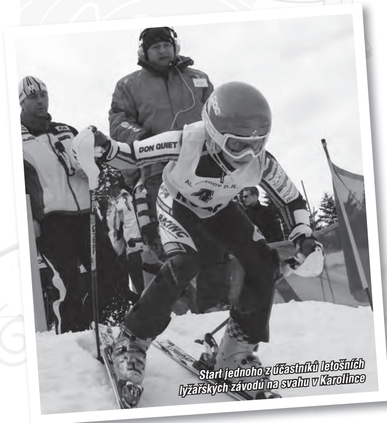
Start jednoho z účastníků letošních lyžařských závodů na svahu v Karolince