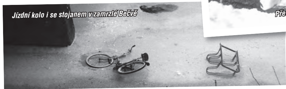
Jízdní kolo i se stojanem v zamrzlé Bečvě