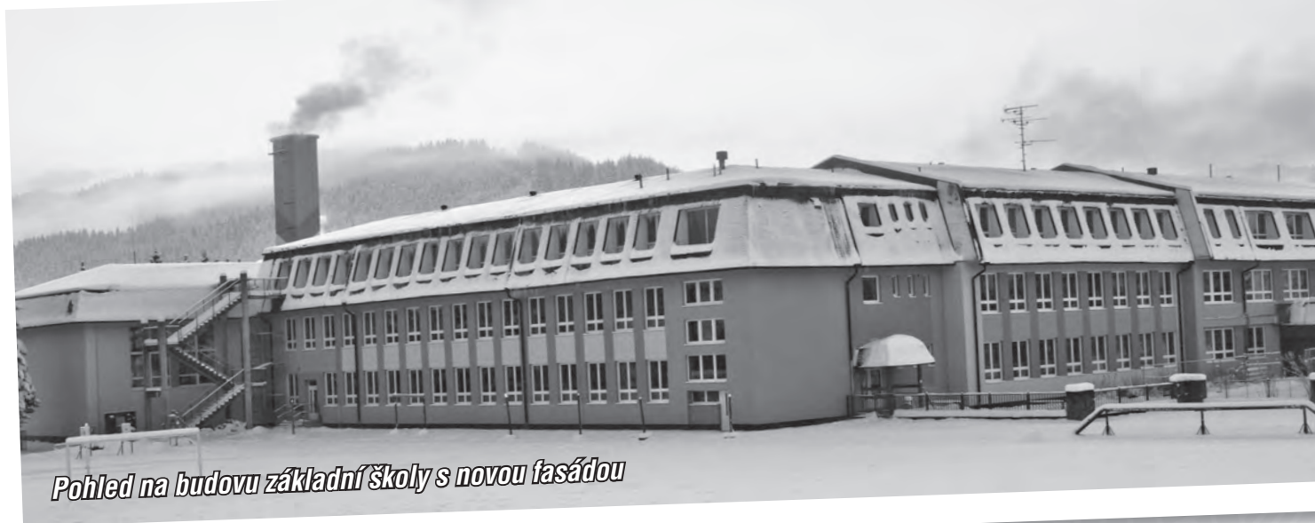
Pohled na budovu základní školy s novou fasádou