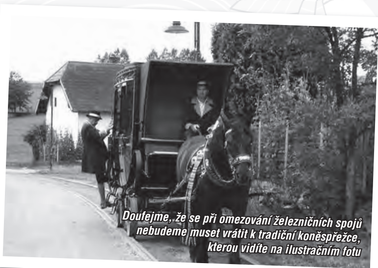
Doufejme, že se při omezování železničních spojů nebudeme muset vrátit k tradiční koněpřežce, kterou vidíte na ilustračním fotu

V železniční osobní dopravě po pouhém roce bohužel končí experiment s taktovou dopravou na Hornovsacké dráze. I když dnes provoz spojů v pravidelném taktu je všeobecně rozšířen ve většině vyspělých evropských zemí a i v naší republice je zaveden na většině železničních tratí, na trati 282 od 12. prosince 2010 již takt nenajdeme. Je to velká škoda, neboť provoz v pravidelném taktu, kdy vlaky odjížděly (až na výjimky) vždy v určitou minutu, řada cestujících přivítala. Časy odjezdů se dobře pamatovaly a cestující prakticky nemusel mít u sebe žádný jízdní řád. S taktem se tedy v novém jízdním řádu již nesetkáme. Stejně tak s vedením přímých vlaků z Horního Vsacka na Hornolidečsko, do Bylnice, Vlárského průsmyku a naopak, což bylo ovšem dáno jen provozními důvody a potřebou vyššího využití trakčních vozidel. Nekoná se ani již před rokem avizovaná náhrada všech vlaků vedených motorovými vozy řady 810 částečně nízkopodlažními jednotkami Regionova. Ve skutečnosti, podobně jako ve stávajícím grafikonu, bude Regionovami obsazena asi polovina vlaků, tedy zhruba každý druhý. V jízdním řádu to poznáme podle symbolu vozíčkáře v horní části vlakového sloupce.