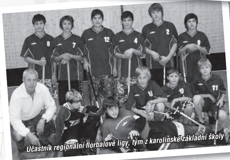
Účastník regionální florbalové ligy, tým z karolinské základní školy