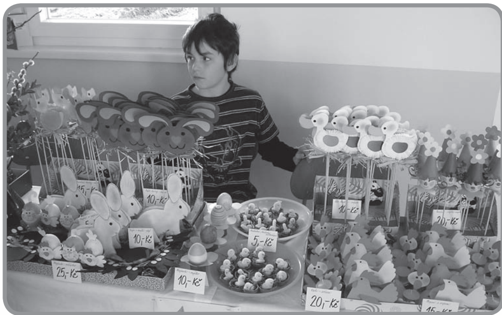
Děti při charitativním prodeji.