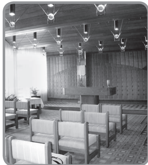
Obřadní síň Karlovy Jany