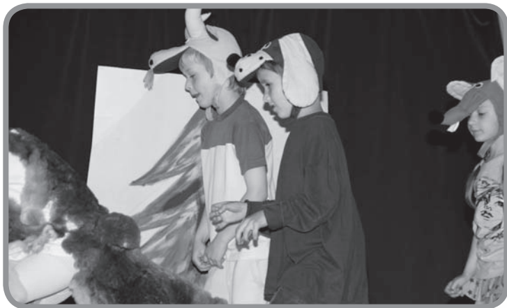
„Prvníci“ a jejich pohádka „O budce“

Počátkem srpna 1978 předčasně skončily prázdniny pro nově se formující učitelský sbor. Úřední dopis je svolal do nově dokončené budovy a začaly práce s úklidem, nošením nábytku, pokládáním koberců a dalšími úkony, které musely být provedeny, aby v pondělí 1. září 1980 tady mohlo začít vyučování.