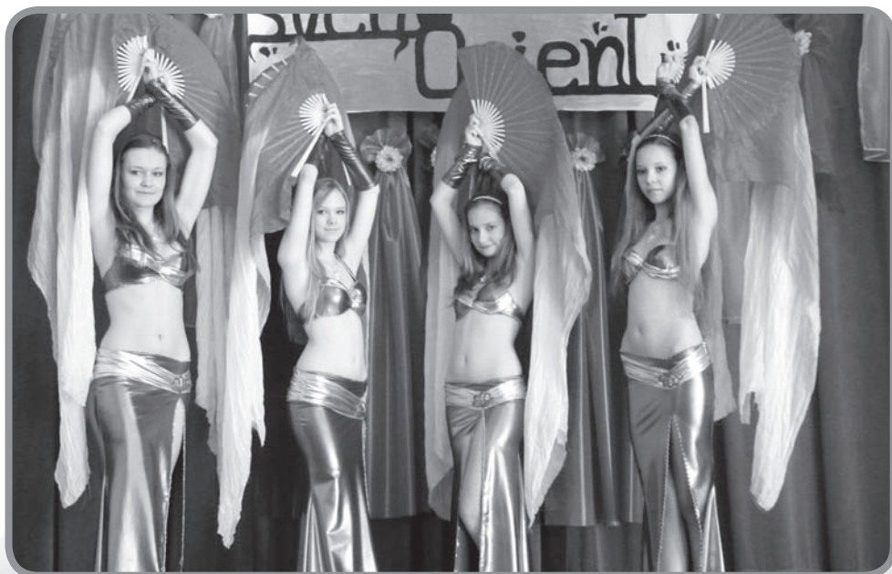
Děvčata při vystoupení