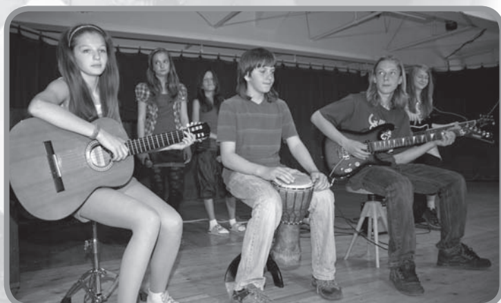
„Sedmička ze sedmičky“ - to byl krásný zážitek