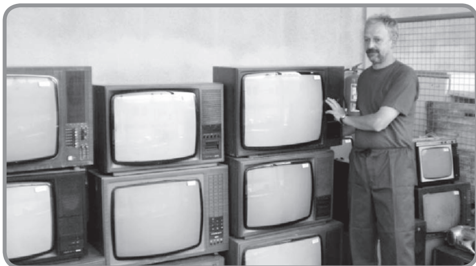
Pracovník Městského bytového podniku Karolinka

Když si uvědomíme, že například osobní automobil vyprodukuje za rok provozu 2 tuny skleníkových plynů a jedna čtyřčlenná domácnost průměrně ročně spotřebuje 2,2 MWh elektrické energie, jsou to impozantní čísla. Přestože studie byla zaměřena pouze na televize a monitory, přínos pro životní prostředí představuje recyklace všech ostatních druhů starých spotřebičů. Dík si zaslouží všichni, kteří nejen elektroodpad, ale i o ostatní pří-