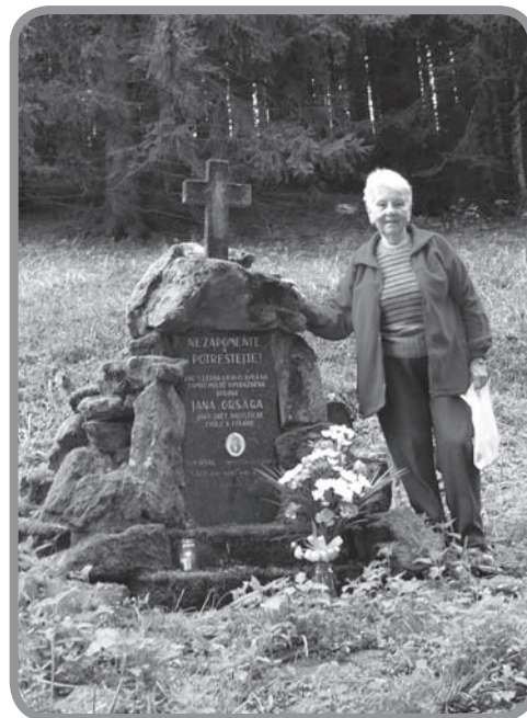
Památník na Jaseníkové