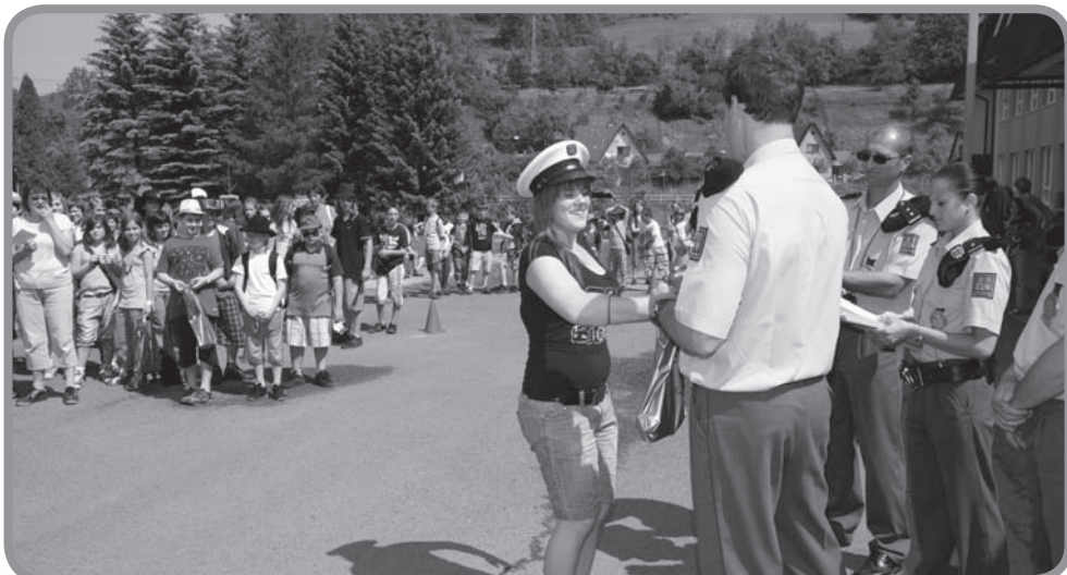
Předání věcných cen