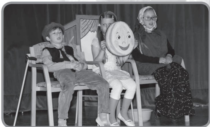
„Druháci“ v pohádce „O kobličkovi“

Časté zatékání a nákladné opravy rovné střechy vyústily ve vybudování druhého patra a valbové střechy. Pamětníci mohou vyprávět, kolik nádob jsme měli rozestavěno po třídách, abychom se při výuce nebrodili vodou, a to jak před stavbou, tak ještě více při ní.