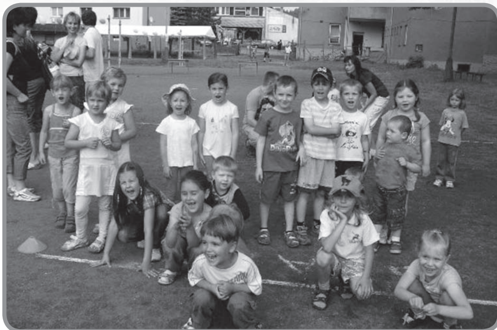
Děti při hrách