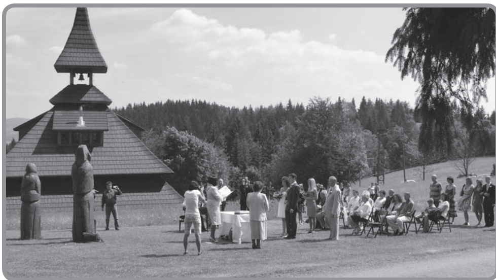
Svatební obřad u Karlovjaneč

Úředně stanovenou dobou pro vykonávání svatebních obřadů je každá sudá sobota. Oficiálním místem pro uzavření manželství je pěkná obřadní síň přímo v budově MěÚ.