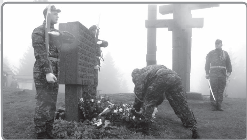
Kladení věnců u památníku