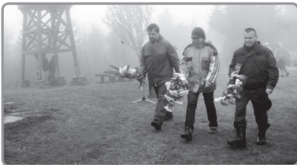
Starostka Karolinky klade květiny k památníku

REDAKCE ČTVRTLETNÍKU „KAROLINKA – MĚSTO V SRDCI VALAŠSKÝCH KOPCŮ“ přeje všem svým čtenářům příjemné prožití letních dovolených ať už doma, nebo v zahraničí.