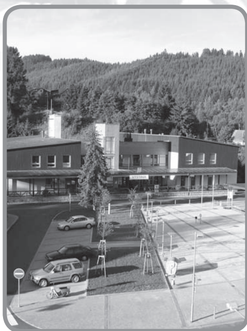
náměstí v Karolince