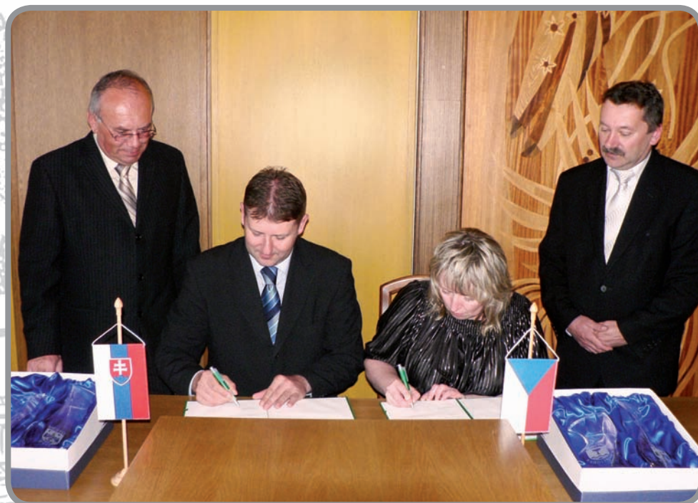
Zástupci měst při podpisu