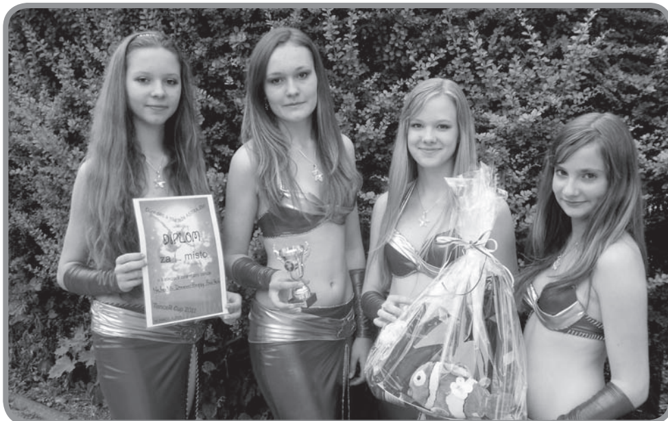
Zlaté tanečnice s cenami