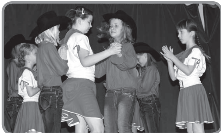
Velmi se líbily country tance v podání děvčat 4. třídy

S další finanční podporou zde za plného provozu vznikly dva sály a učebny pro Základní uměleckou školu, moderní posluchárny pro výuku fyziky, chemie, přírodopisu a výpočetní techniky, školní družina, u schodiště s výtahem pro bezbariérový přístup do vyšších podlaží postavili výtah, který vás přiveze do městské knihovny. Takové centrum vzdělávání nemají ani vel-