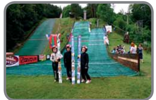
Banská Bystrica – pod můstkem s kolegy z oddílu