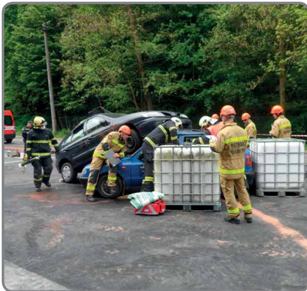
Družstvo na soutěži ve Zlíně