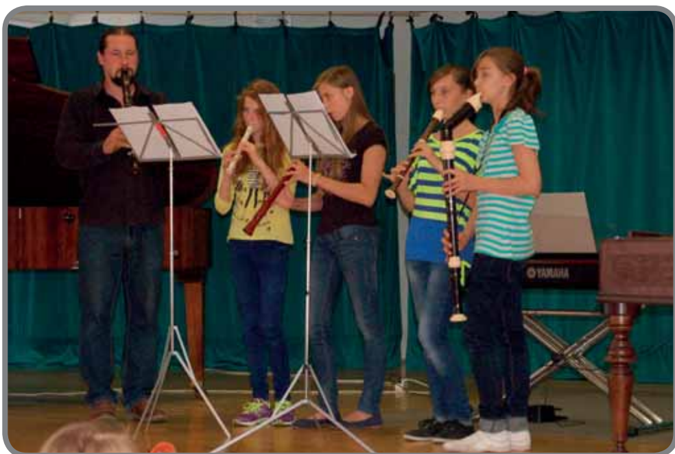
Koncert žáků I. stupně