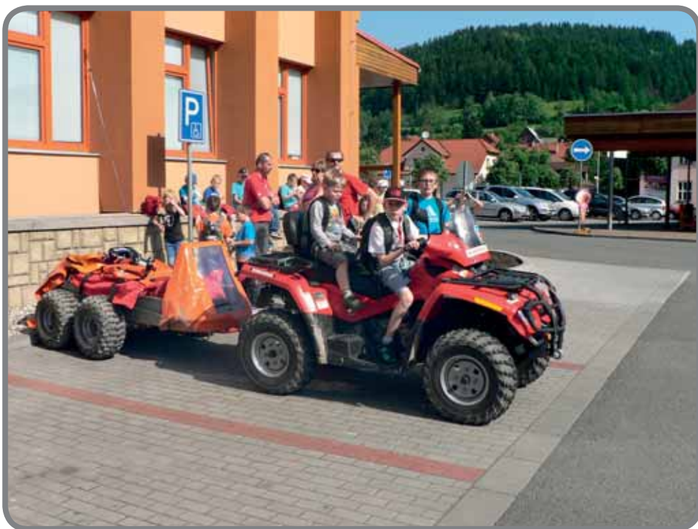
Den s IZS