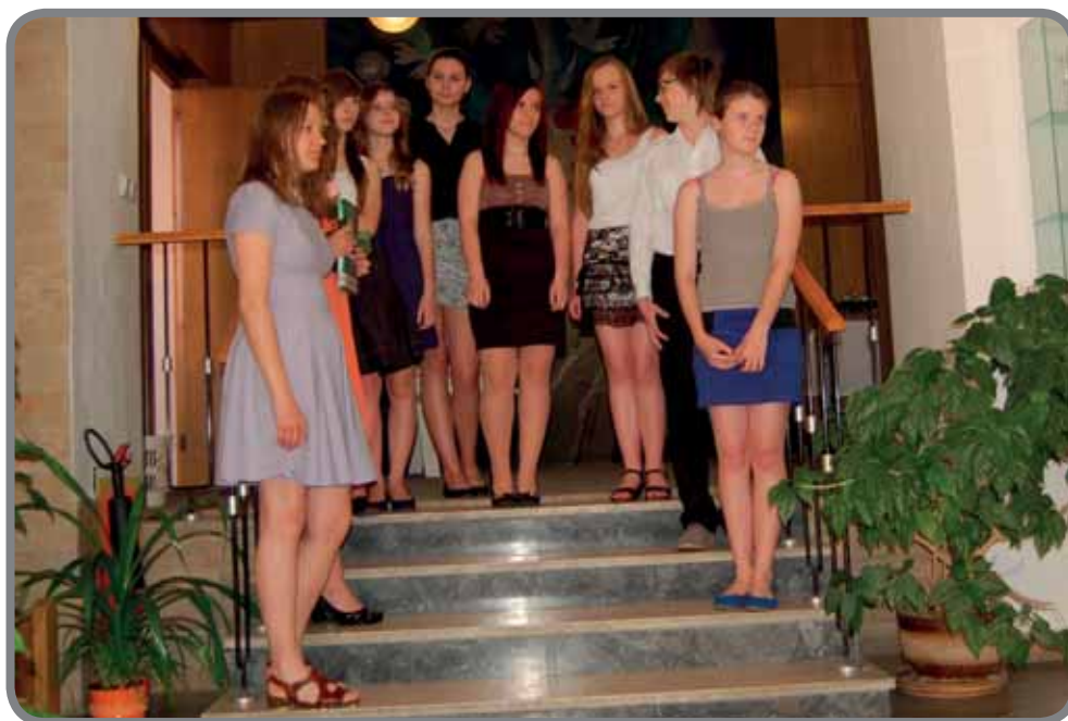
Vernisáž VO na Městském úřadě v Karolince

Žáci literárně dramatického oboru byli také velmi pilní. Proběhlo celkem pět představení: Jak princezna tancovala s čertem, Perníková chaloupka, Sněhurka a sedm trpaslíků, Co jsme letos stihli a posledním představením byla inscenace