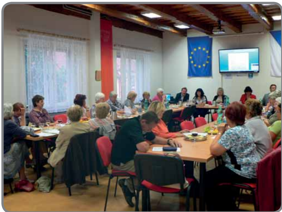
Ukončení kurzu Moderní senior