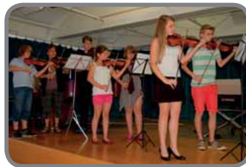
Koncert žáků I.stupně