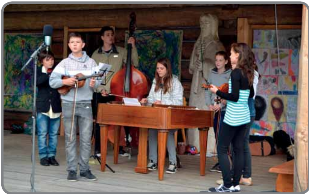
Vernisáž VO v Karlovském muzeu