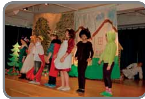
Vystoupení LDO Perníková chaloupka