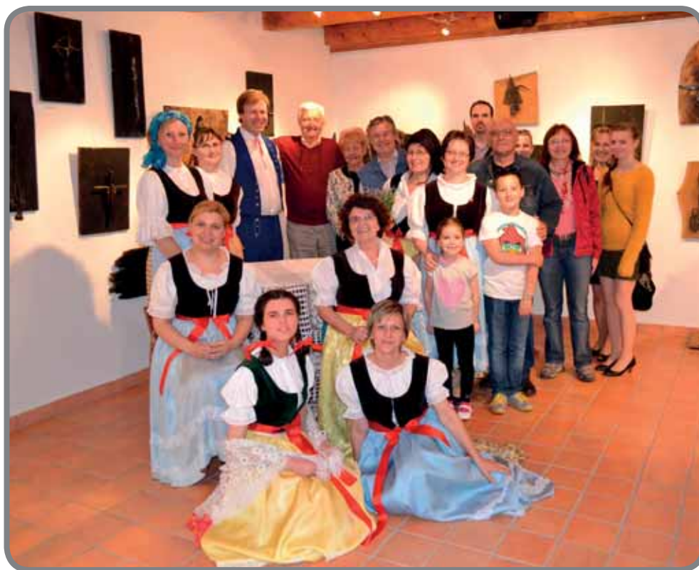
pořád L. Janáček

Program začal 20.4.2014 ve 13 hodin a pro malé i velké byla připravena řemeslná dílna, ve které si zájemci vyzkoušeli výrobu z tradičních „jarních“ materiálů – proutí a slámy – výrobu metliček, metel, pletení tatarů, ozdob ze slámy, ale také malování velikonočních kraslic, holubiček a zdobení velikonočních perníčků. Zpěv a hudba cimbálové muziky Kordulka ze Vsetína a lidové hudby souboru Bystričan ze Slovenska provázela po celé odpoledne.