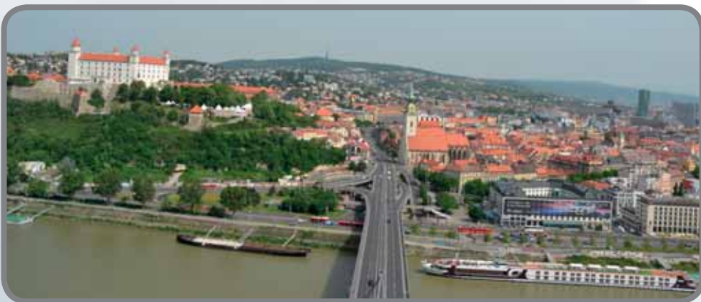
Pohled na Bratislavu z kavárny Bystrica

Plavba lodí z bratislavského říčního přístavu k Děvínu byla příjemným dvou-