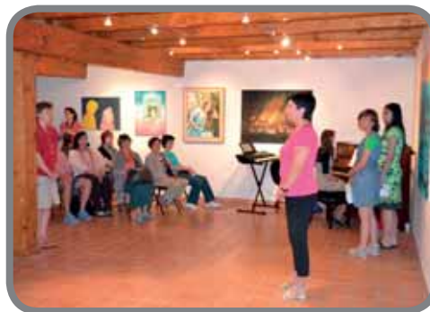
Vernisáž - sklářská škola