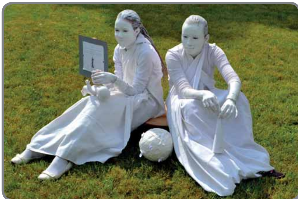
Vernisáž VO v Karlovském muzeu