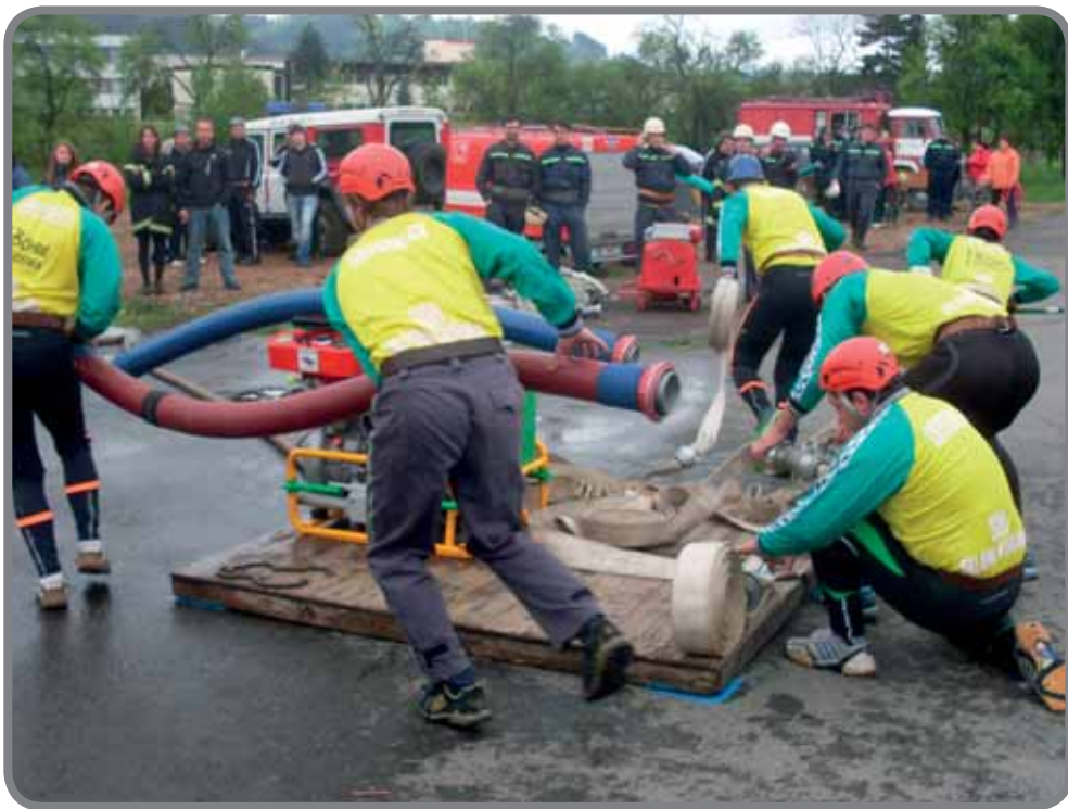
Obvodové kolo Hovězí