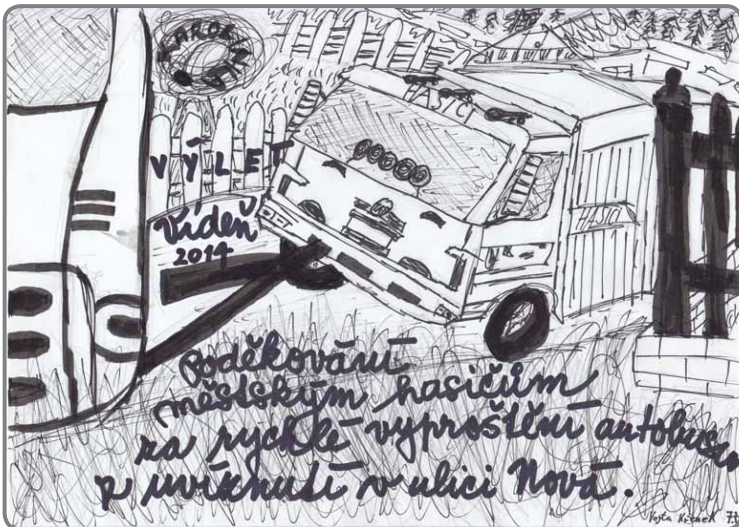
Kresba – Vojtěch Křenek, 7. třída