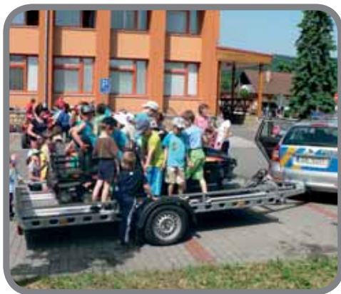
Den s IZS