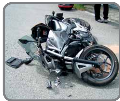
Nehoda motocyklu ve Vranči

Jelikož se naše činnost neobejde bez finančních prostředků, jsme velmi rádi, že nám Zlínský kraj v letošním roce přispěl na činnost, a to účelovou neinvestiční dotací z rozpočtu Zlínského kraje, a to ve výši: