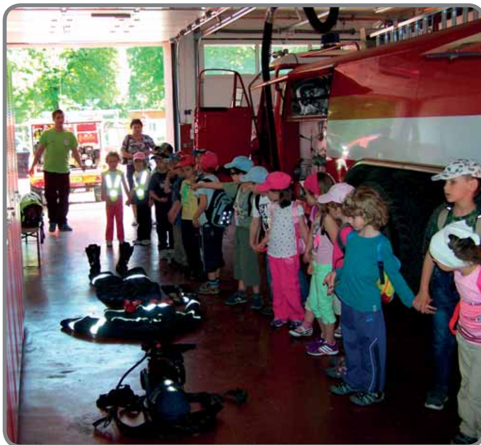
Den s IZS