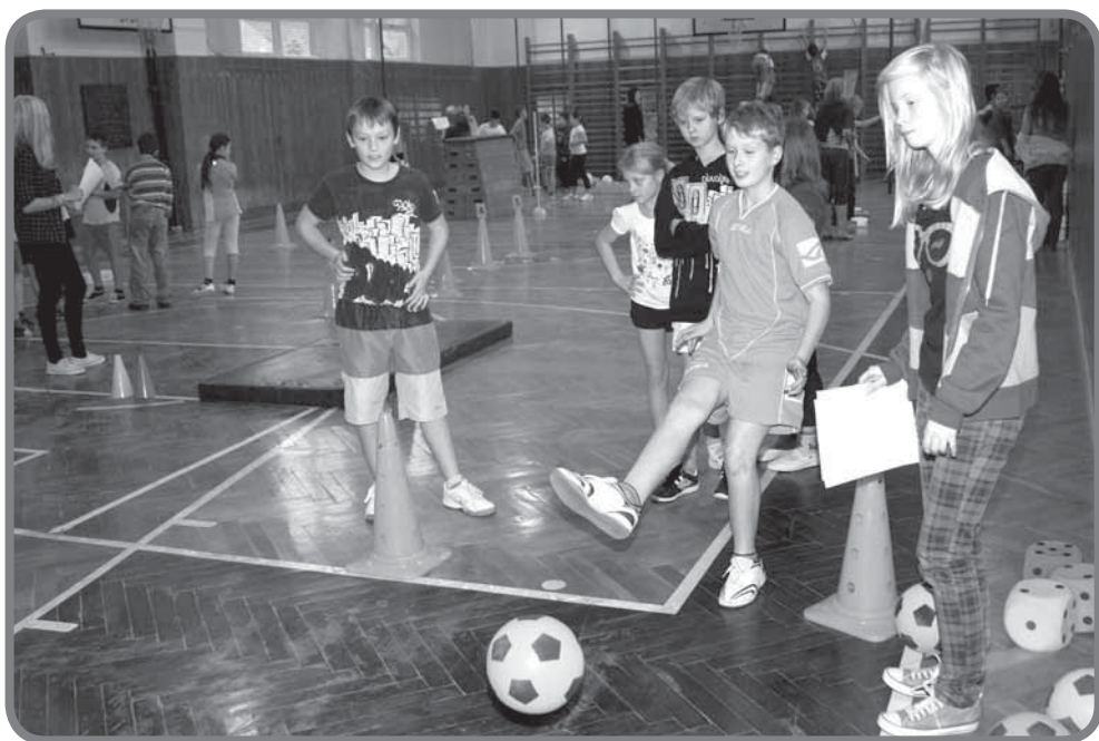
Vánoční sportování ve 4. a 5. třídě