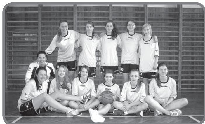
Starší žákyně – košíková