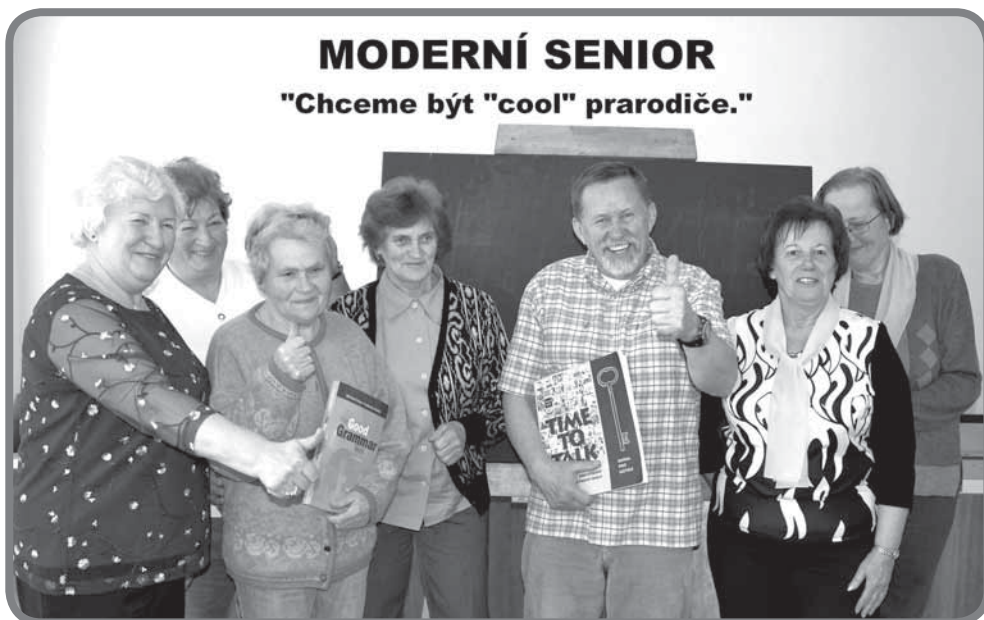
MODERNÍ SENIOR "Chceme být "cool" prarodiče."

Dne 19. března 2015 se uskutečnilo slavnostní vyhodnocení fotosoutěže, která byla vyhlášena Sociálním fondem Zlínského kraje. Akce pro naše seniory již druhý rok také podporuje Zlínský kraj, proto jsme do soutěže odeslali tři fotografie také my – město Karolinka. Autorkou všech odeslaných fotografií byla Ing. Barbora Václavíková, Ph.D., která naše významné akce pravidelně fotografuje.