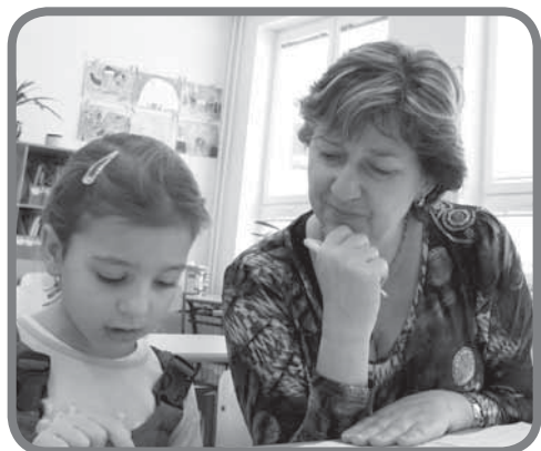
Zápis do 1. třídy