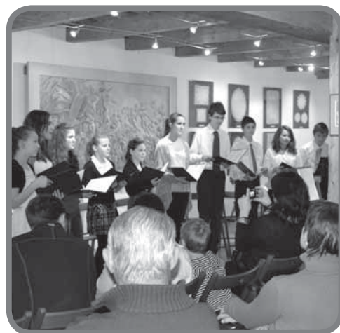
Pěvecký sbor při ZŠ Velké Karlovice