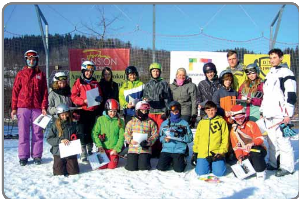
Lyžařský výcvik 7. třídy