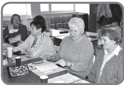
Přednáška Dějiny přírodních věd a školství