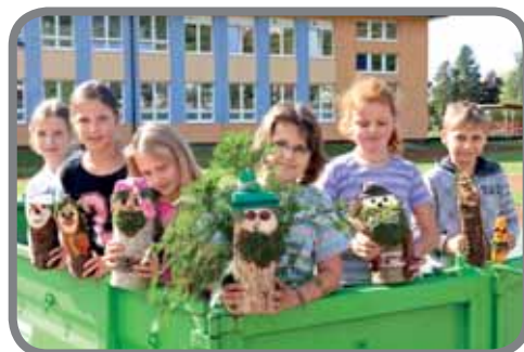
Lesní skřítko ve 4. třídě